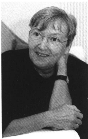
克里斯蒂娜·涅斯特林格,(1936~),奥地利当代著名儿童文学作家。主要创作童话、诗歌、小说、剧本,代表作有《脑袋里的小人》等,1984年国际安徒生奖得主、2003年首届林格伦奖得主。

由此我得出结论,很不情愿地说,儿童图书市场在几年内会缩小。爱读书的孩子所占的儿童人口比例,不会大