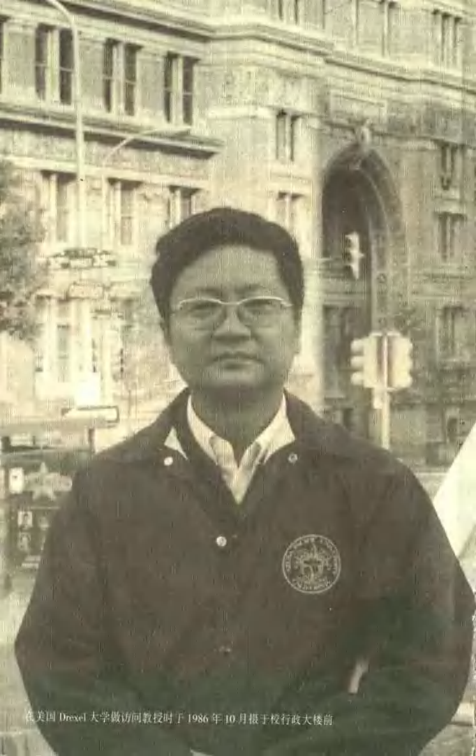
在美国 Drexel 大学做访问教授时于 1986 年 10 月摄于校行政大楼前