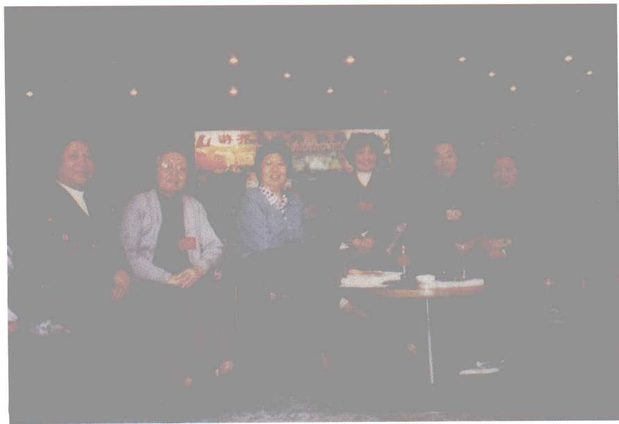
李吉林与语文界前辈在一起。（右起依次为：斯霞、霍懋征、李吉林、潘仲茗、袁榕、戴宝云。）