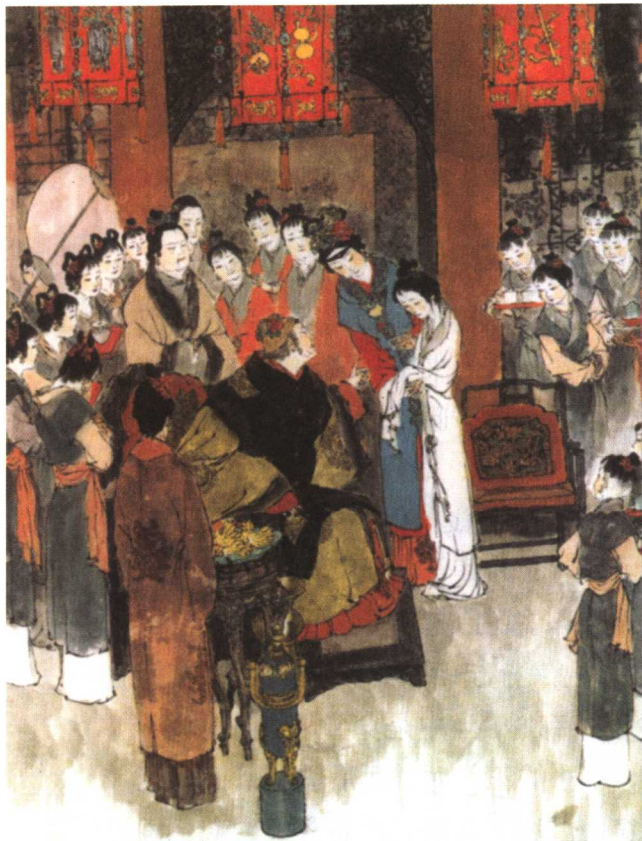
接外孙贾母惜孤女 戴敦邦 绘

不一时，只见三个奶嬷嬷并五六个丫鬟，簇拥着三个姊妹来了。第一个肌肤微丰，合中身材，腮凝新荔，鼻腻鹅脂，温柔沉默，观之可亲。第二个削肩细腰，