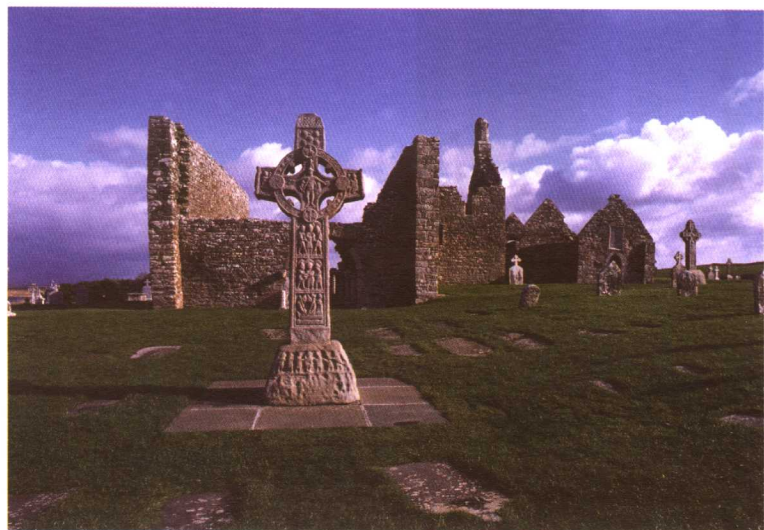
克朗马克诺斯遗迹