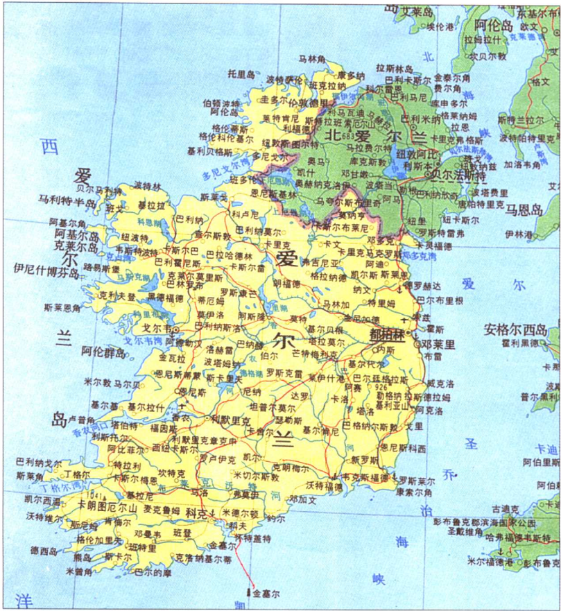
爱尔兰行政区划图