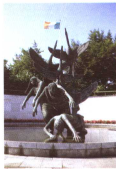
自由战士纪念公园