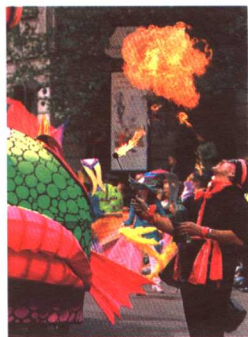
圣帕特里克节日庆典