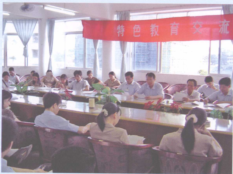
课题组举行人格系列特色教育交流研讨会