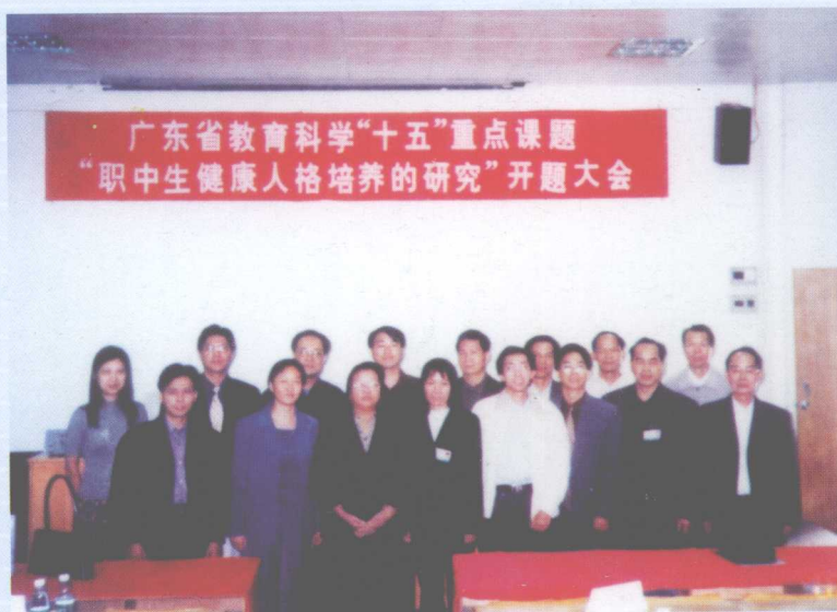
有关领导、专家及课题组主要成员出席开题大会