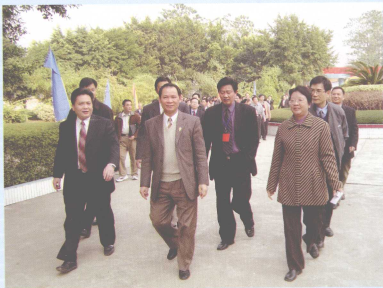
广东省教育厅副厅长李鲁等省、市、区领导到校视察