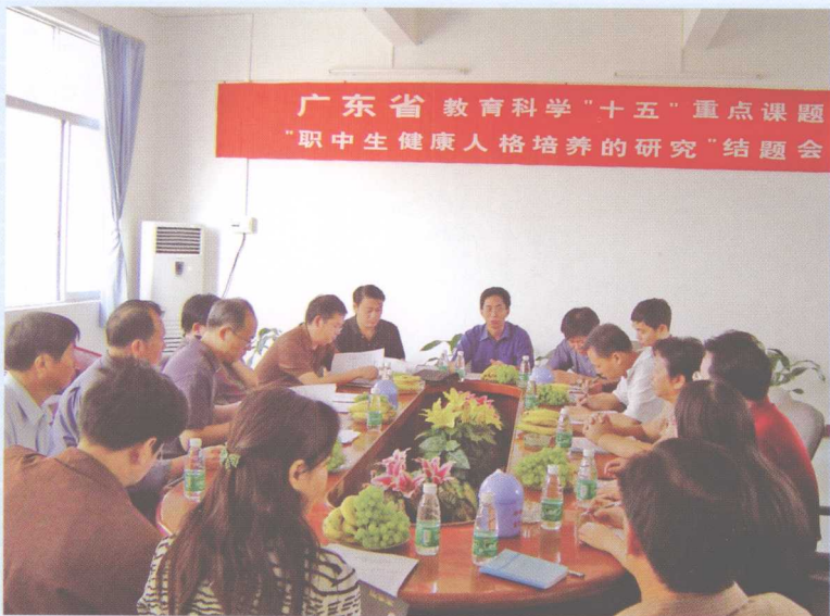
广东省教科鉴定组专家在我校召开人格课题结题评审会