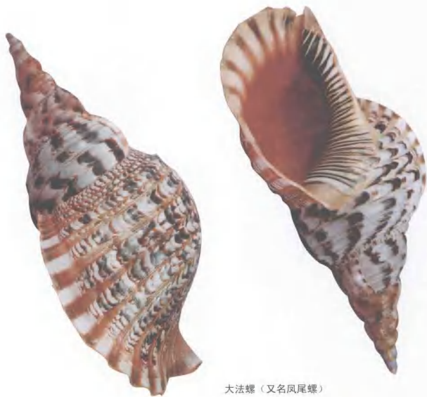
大法螺（又名凤尾螺）