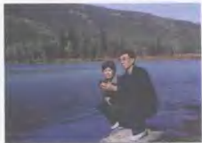
中华文夫妇在新疆喀纳斯湖畔

七彩纷呈的贝壳奇石，与多彩的人生有着很多的相似之处。一枚奇特的贝壳或一方精美的奇石，往往是在特殊的环境中生成，有的曾在沧海中孕育，有的曾在深土中幻化，有的曾在荒漠中磨砺，有的曾在激流中搏击，最终以真实和本色示于世人。当我们受到其灵气的熏陶时，就可以从中悟出人生哲理，获得一次次心灵感受。