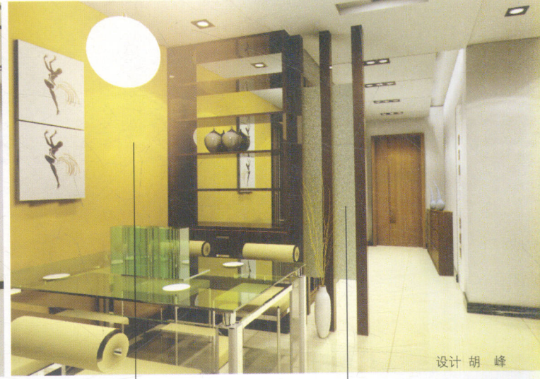
设计 胡 峰