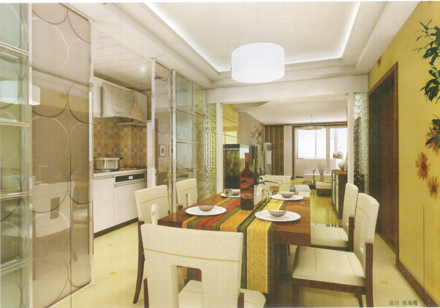
— 玻璃推拉门 —