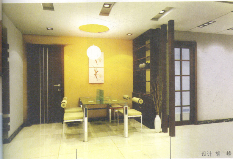
设计 胡 峰