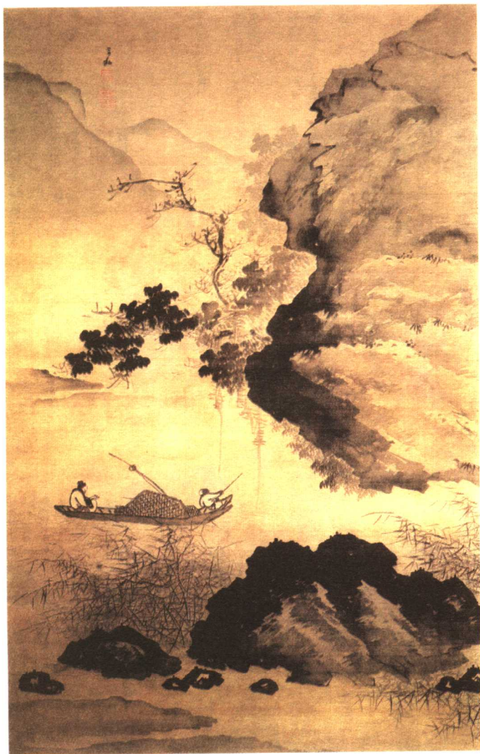
渔舟读书图 明·蒋嵩