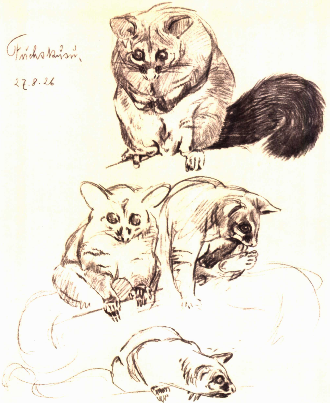
扫尾袋貂 写生 地点不详 1926年8月27日 铅笔、黄纸 22cm × 31cm