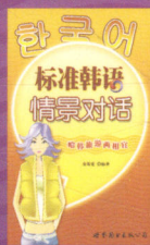
标准韩语情景对话