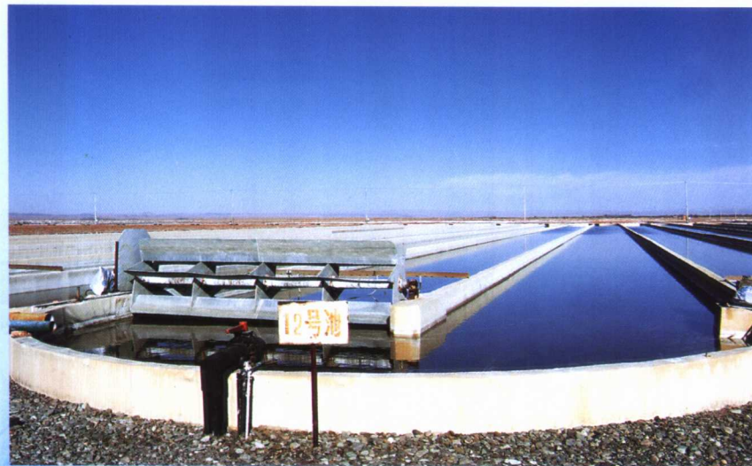
内蒙古阿拉善盟兰太实业股份有限公司生物分公司盐藻生产基地。