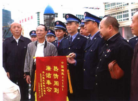
2005年12月,香港流动渔民协会代表向广东省渔政总队深圳市支队赠送锦旗,感谢该队多年来服务渔民、救助渔船所做的大量工作。图为该队队长和政委接受锦旗。