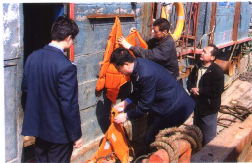
中华人民共和国大连渔港监督局工作人员定期帮助渔民检查安全设施设备，宣传安全生产知识，消除安全隐患，努力构建平安渔业。

渔政船是渔政执法人员的工作平台，代表渔政队伍形象。创建活动中涌现了一批执法规范、举止文明、环境整洁、服务周到的渔政船，图为中国渔政302船驾驶台。