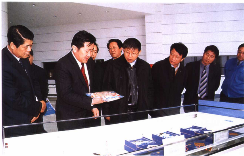
2006年4月中旬，农业部副部长范小建考察大连渔业。18日在大连獐子岛金贝广场视察。