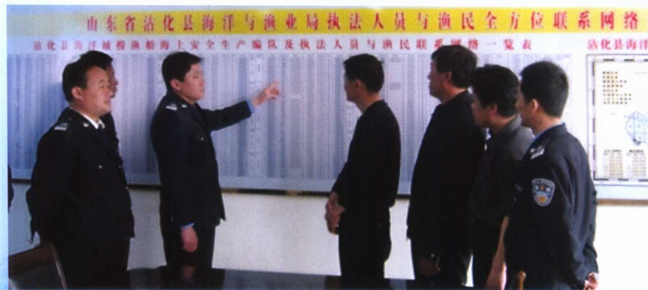
山东省沾化县渔政渔港监督管理局坚持执法为民,构建和谐渔区,建立了与辖区全部渔民全方位联系网络体系。图为该局领导正在向渔政人员宣讲如何做好服务工作。