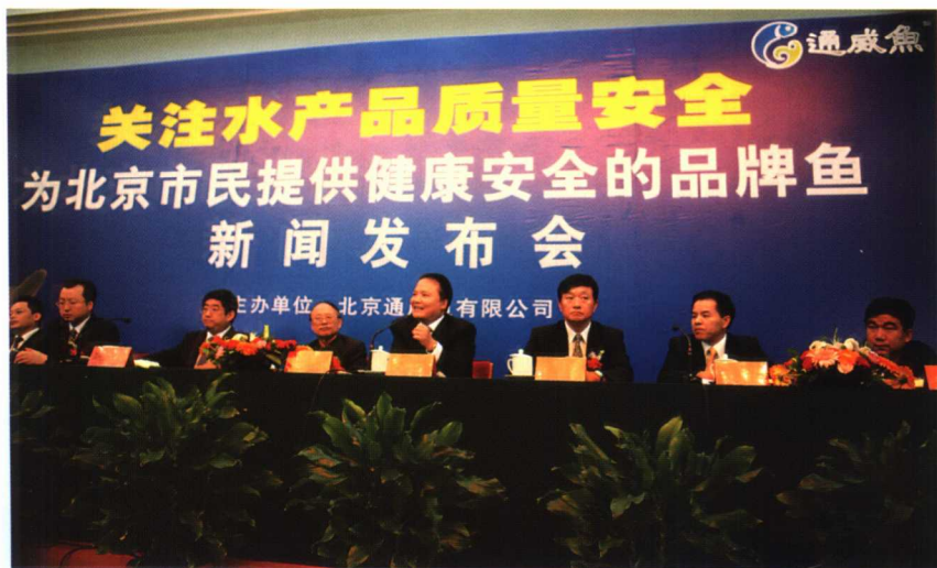
通威鱼首都上市新闻发 布会在北京人民大会堂隆重 举行。