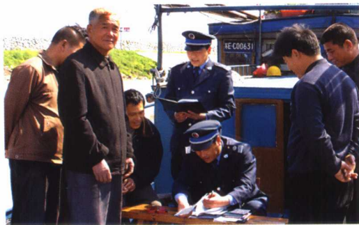
为解决渔民住家远、办证难的问题，窗口单位从实际出发，主动进渔村、上渔船、访渔民办理各种渔业证件。图为2006年3月江苏省张家港市渔政管理站在渔船上为渔民办理捕捞许可证。

通过创建活动，渔业行政执法队伍在建立长效激励机制方面进行了有益的探索，强化从服务角度考核渔业执法成效，增强了渔业执法人员为民服务意识和依法行政观念，将对推进我国渔业执法队伍建设产生长远影响。