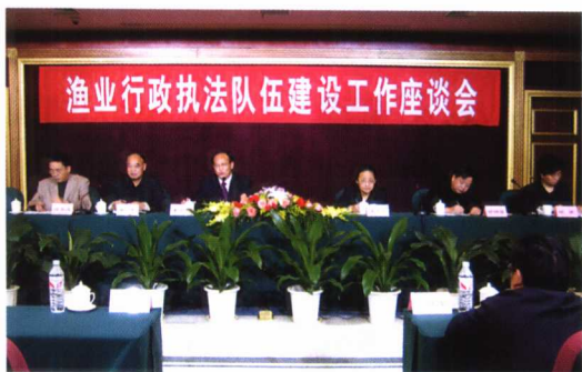
2006年1月,中华人民共和国渔政渔港监督管理局召开渔业行政执法队伍建设工作座谈会,研究并部署渔业文明执法窗口单位创建活动。