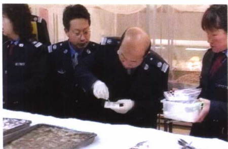
陕西省咸阳市渔政监督管理站积极拓展执法领域,开展水产质量安全执法检查。图为该站在创建活动期间,在水产品超市检查水产品甲醛含量。