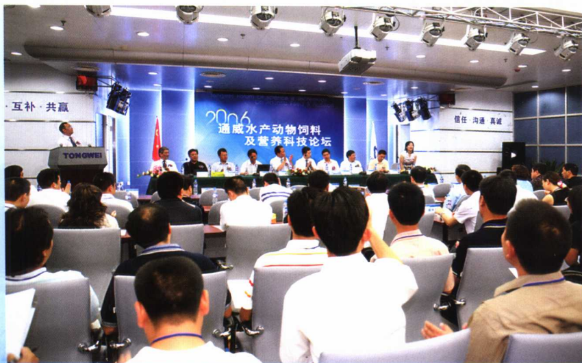
首届通威水产动物饲料 及营养科技论坛在成都隆重 举行。