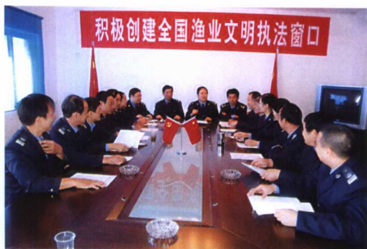
各地响应农业部号召,采取多种方式宣传动员,积极开展渔业文明执法窗口单位创建活动。图为2006年2月湖北省宜昌市渔政船检港管理处召开的创建活动动员会。