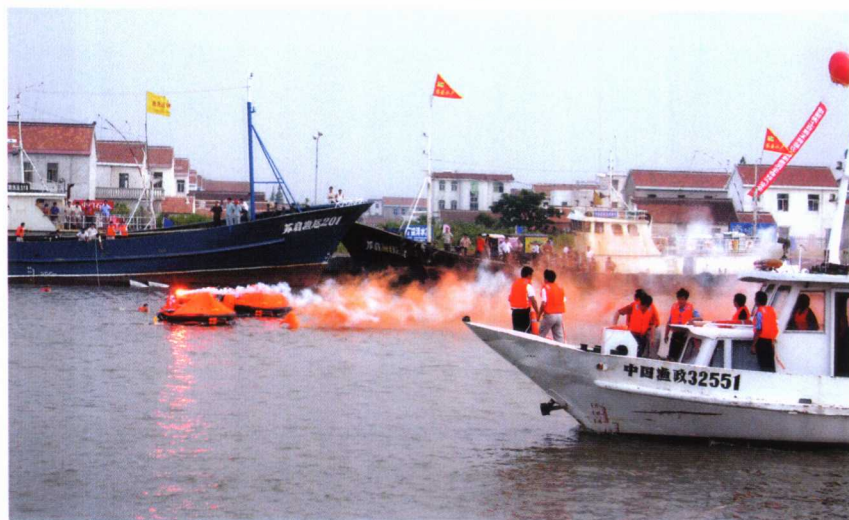
水上突发安全事故应急演练。