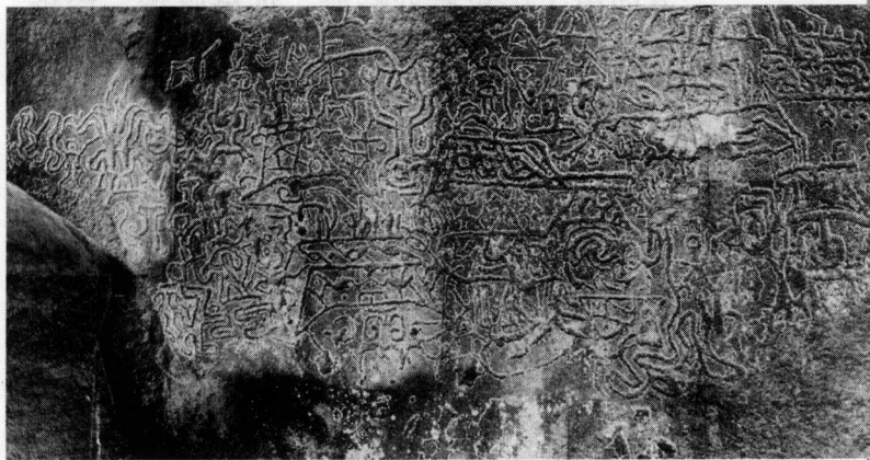
珠海高栏岛青铜时代的岩画

相对于中国主流画坛，广东绘画的发源要远远晚于中原、江浙和西南地区。在史前和春秋战国时代，偶尔有些岩画和印纹陶、青铜纹饰传于后世，或许这可作为目前所见广东绘画的最早起源，其中比较有名的是珠海高栏岛宝镜湾之岩画，是广东地区早期民间绘画之雏形。