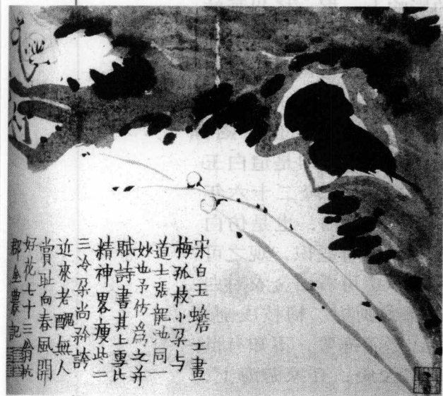
清代·金农仿白玉蟾《梅花图》（浙江省博物馆藏）