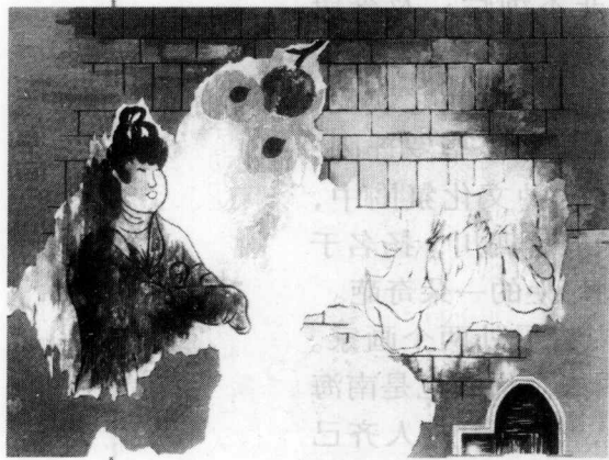
唐张九龄墓室壁画（摹本）

此外，在近代的考古发现中，唐代广东的一些墓葬如在曲江发掘的张九龄墓等，也有不少精美的墓室壁画，反映了这一时期广东民间画工的绘画水平。