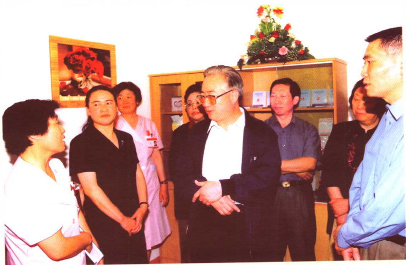
国家人口计生委主任张维庆来朝阳区视察指导工作。