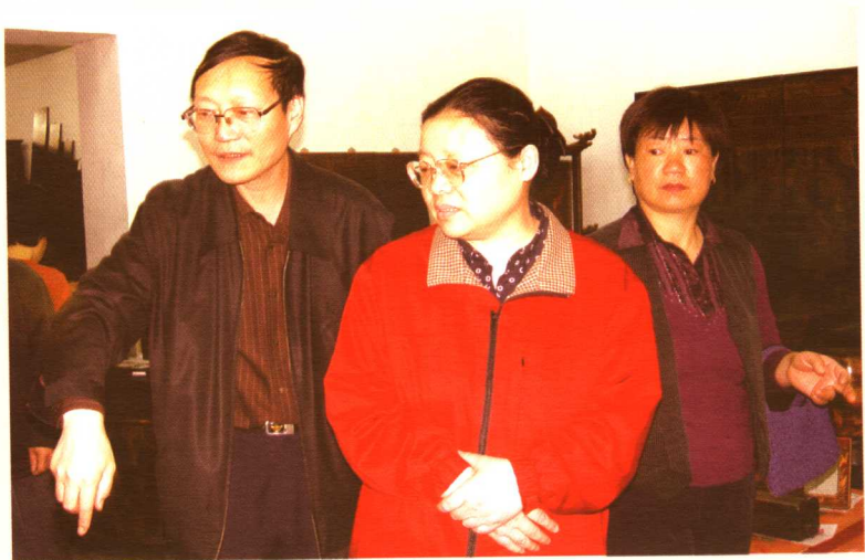
北京市人口计生委副主任李芸莉在朝阳区高碑店地区办事处检查指导工作。