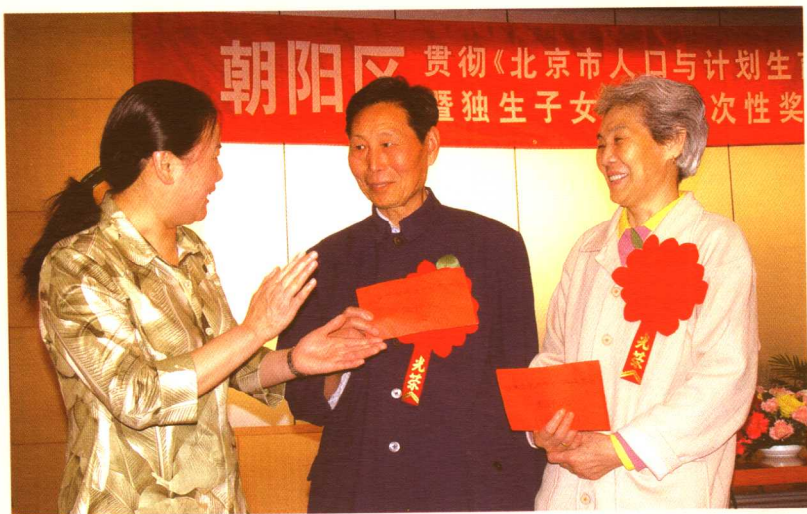
朝阳区召开独生子女父母一次性奖励费发放现场会。