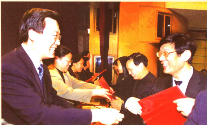
在朝阳区人口和计划生育工作会上，中共朝阳区区委书记李士祥为先进单位颁奖。