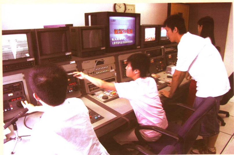
朝阳区有线电视台开设人口计生专栏。