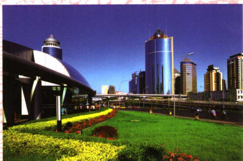
朝阳卷 CHAO YANG JUAN