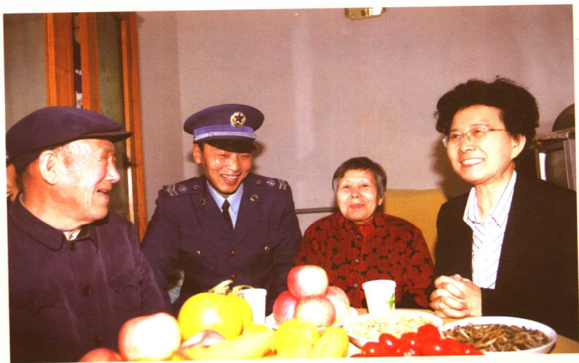
国家人口计生委副主任潘贵玉到朝阳区小红门地区办事处调研指导工作。