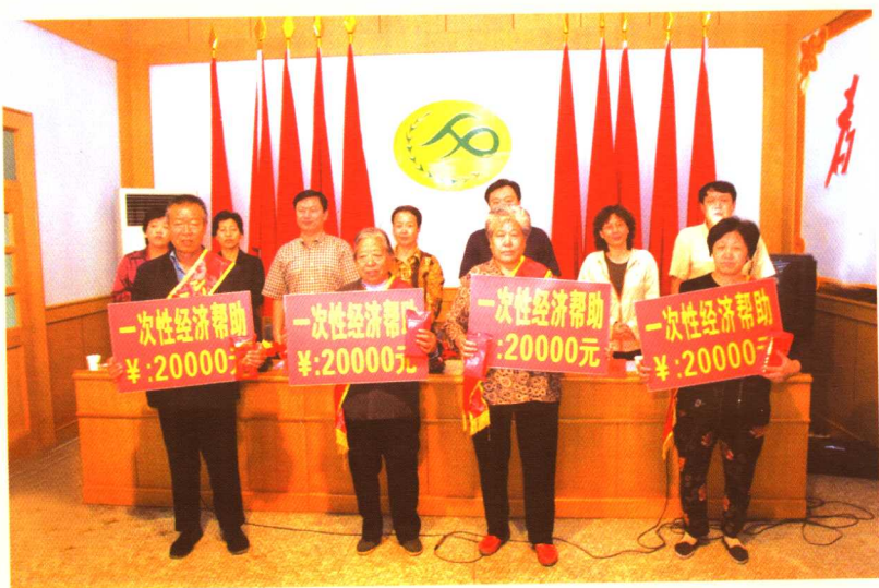
朝阳区小红门地区办事处向计生户发放一次性经济帮助。