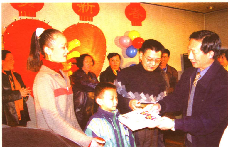
北京市人口计生委主任邓行舟参加朝阳区基层的计划生育宣传活动。