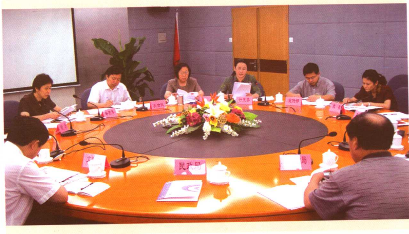
朝阳区计划生育综合治理部门召开联席会议。