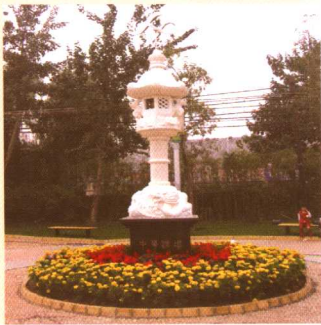
六里屯街道的人口文化园。