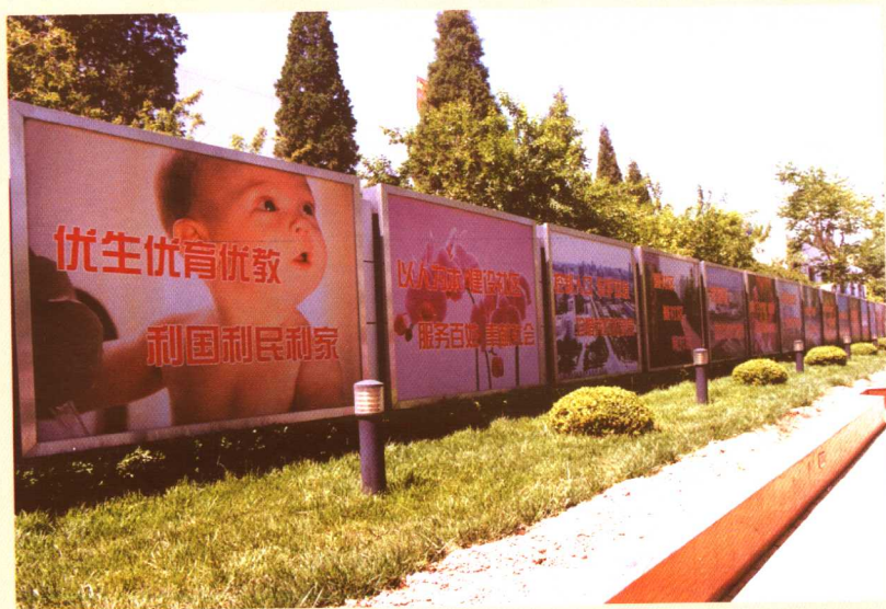
香河园街道的计划生育宣传广告。