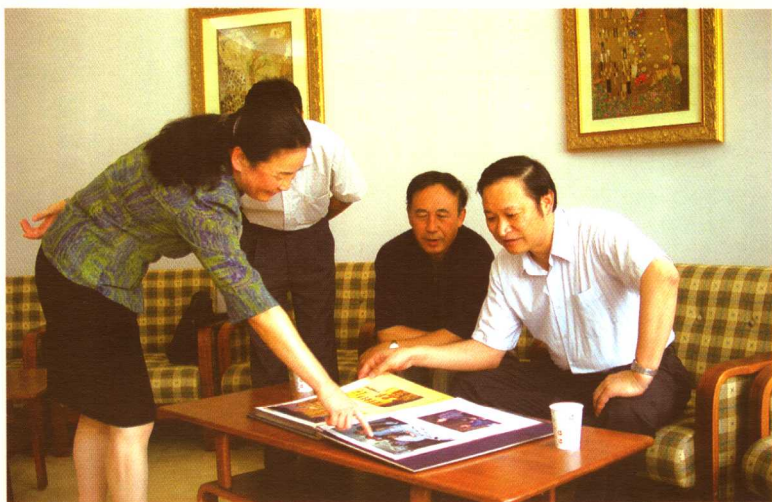
国家人口计生委副主任王国强在朝阳区计划生育宣传技术服务中心调研指导工作。