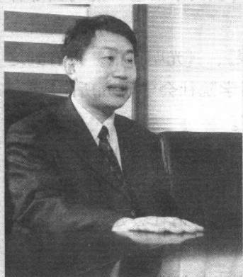
著名社会学家李培林

李培林，著名社会学家、中国社会和谐问题研究专家。1955年5月出生于山东济南，1982年毕业于山东大学哲学系，1984年获法国里昂大学硕士学位，1987年获法国巴黎第一大学社会学博士学位。历任中国社会科学院社会学研究所城乡社会学研究室副研究员、工业社会学研究室主任；现为中国社会科学院社会学研究所党委书记、副所长，兼研究生院社会学系主任、博士生导师。并兼任中国社会学会常务副会长、国家社会科学基金评审委员会委员、马克思主义理论工程社会学专家组成员、《中国社会科学》杂志编委会委员；还兼任法国高等社会科学院博士指导教授，南开大学、北京师范大学、上海大学、武汉大学、山东大学、中央财经大学等多所大学兼职教授和特聘教授。系国家“有突出贡献中青年专家”，国家“十一五”规划专家委员会委员；曾获“国家留学人员成就奖”。