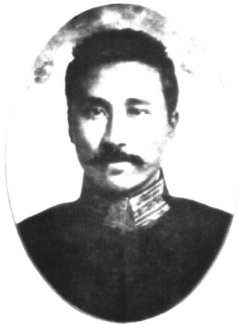
1912年陈炯明任广东代都督照