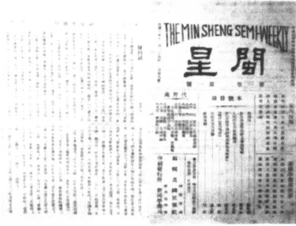
1919年12月陈炯明创办之《闽星》