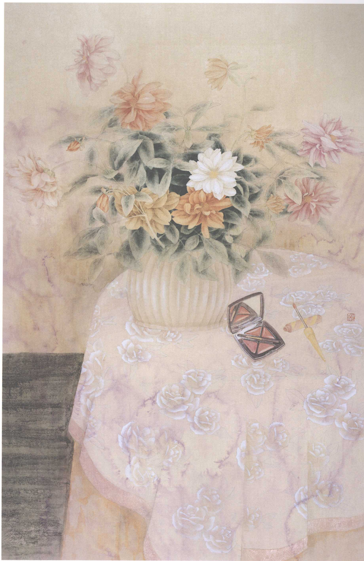
晨 2004年 115cm × 75cm 绢本设色