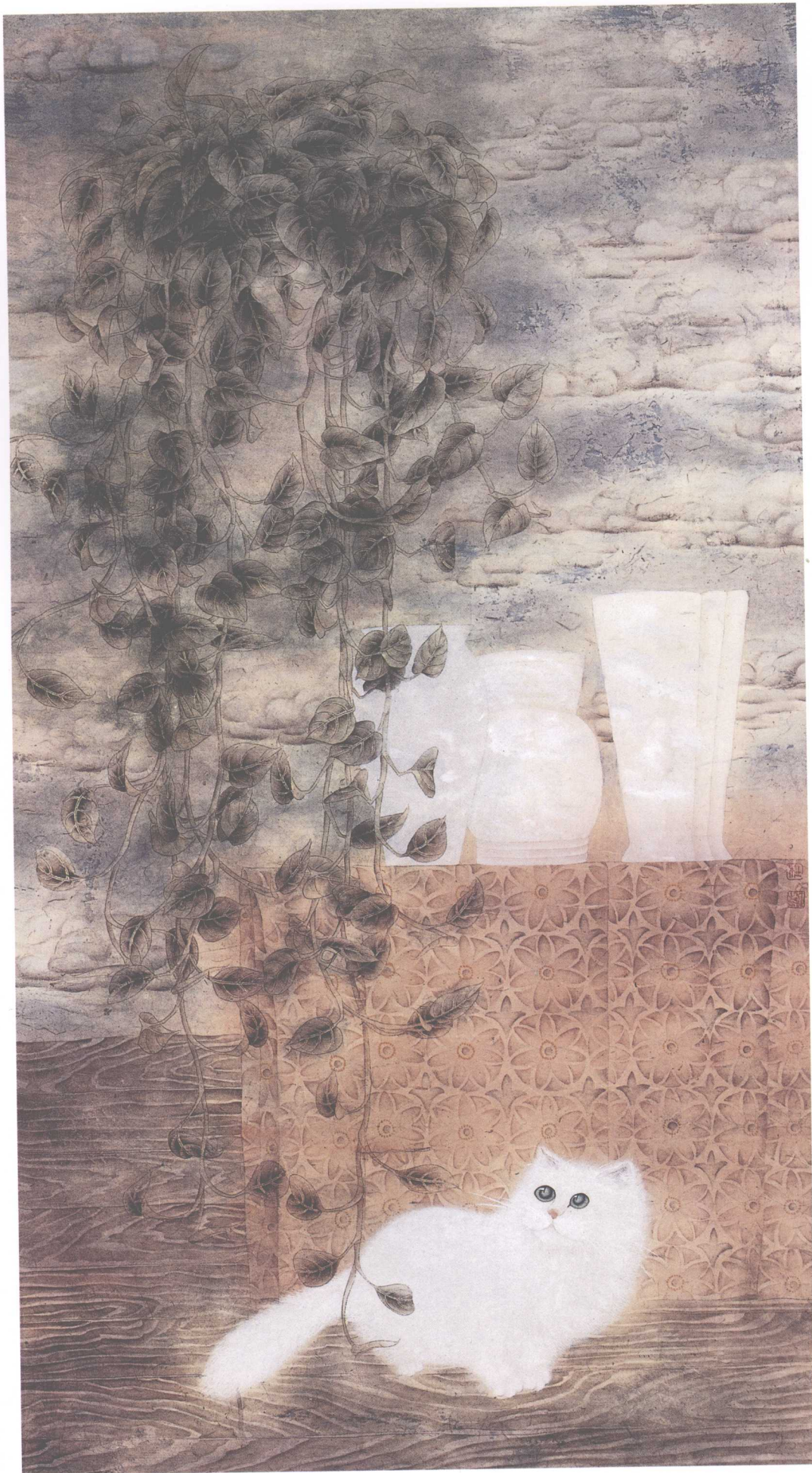
风暖云舒 2005年 140cm × 75cm 纸本设色