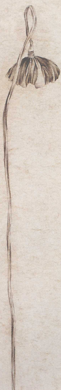
澀之一 2004年 150cm x 30cm 紙本設色