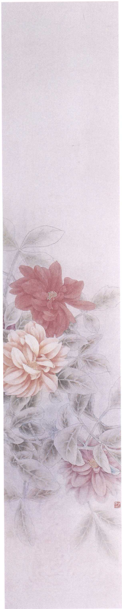
那日的美丽之三 2004年 150cm × 30cm 纸本设色