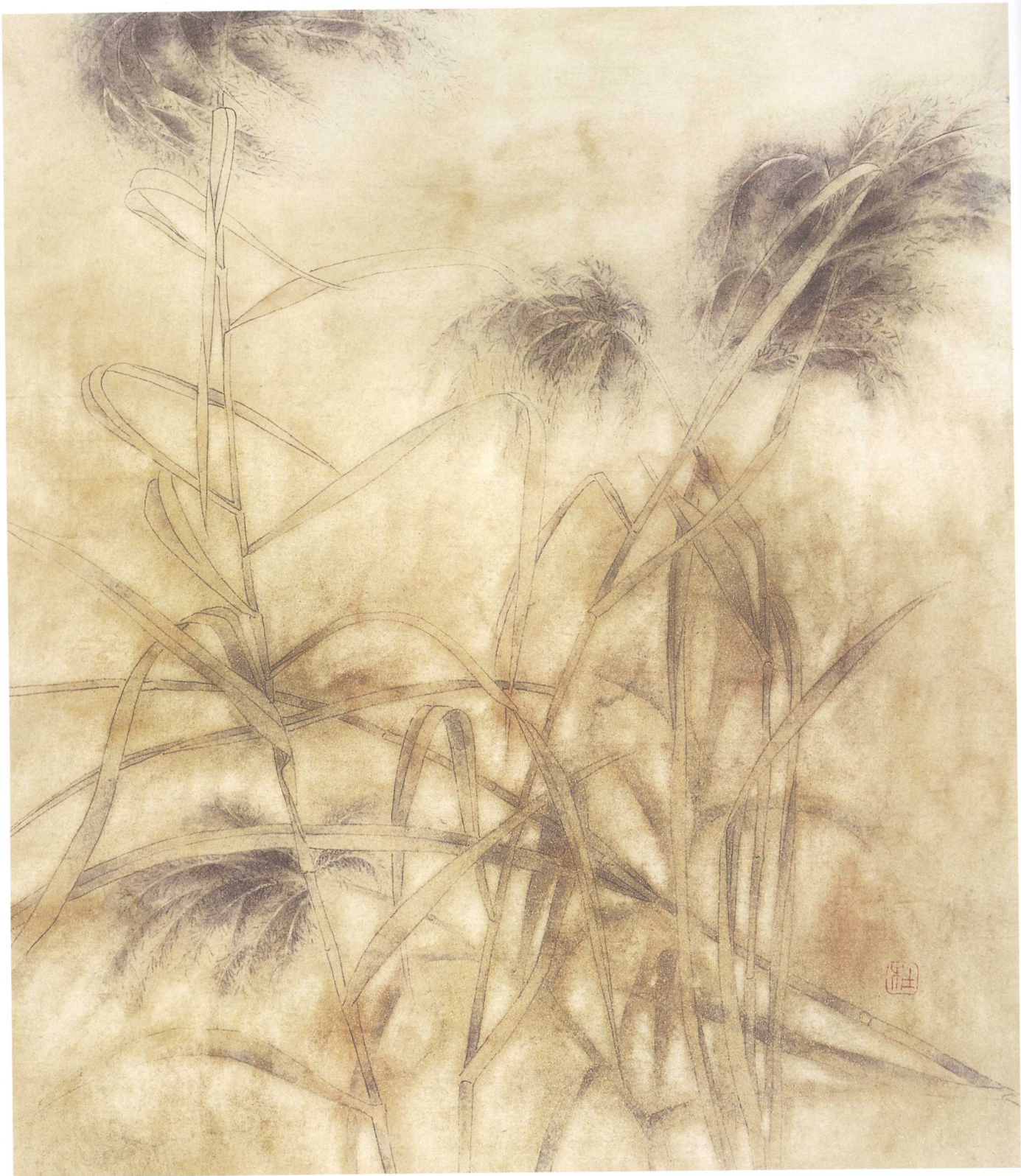
秋意 2004年 55cm x 44cm 纸本设色