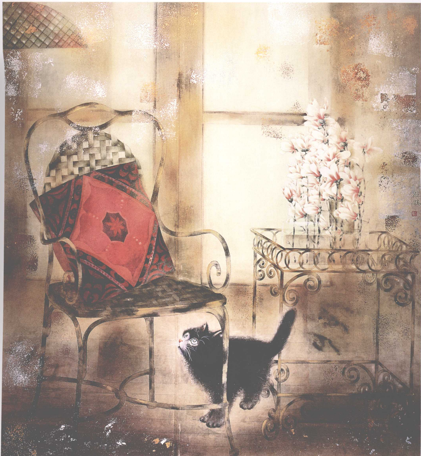
闲居 2004年 150cm × 140cm 纸本设色