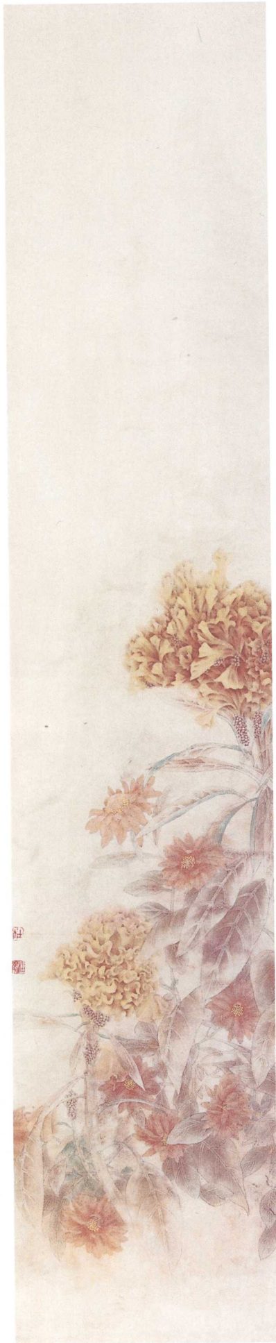
那日的美丽之一 2004年 150cm x 30cm 纸本设色