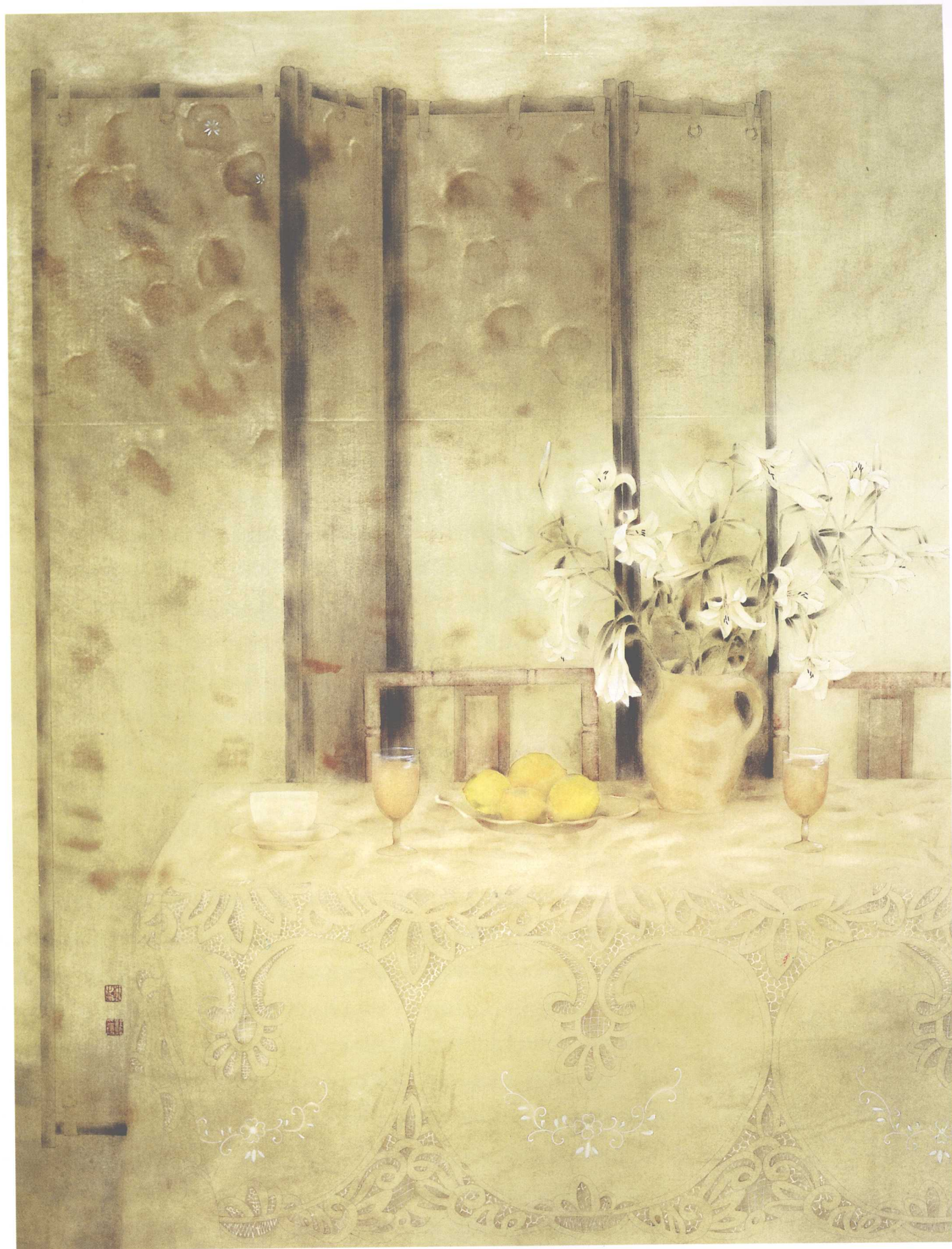
桌上的百合花 2004年 115cm × 90cm 纸本设色