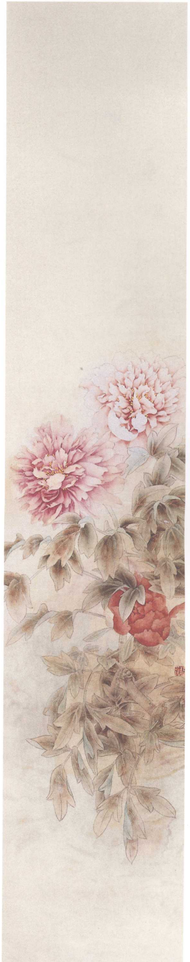
那日的美丽之二 2004年 150cm x 30cm 水墨纸本