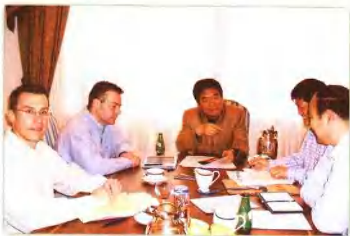
作者（中）与美国CG公司洽谈。