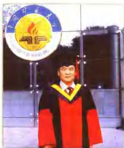
作者博士学位毕业照。