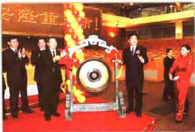
2006年11月23日上午，河南省人民政府副省长史济春（左三）与作者（左四）在上海证券交易所一起为平煤天安A股鸣锣开市。