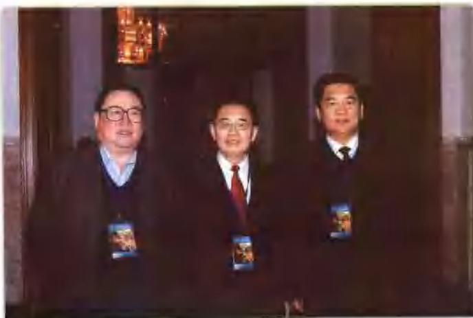
2006年5月，第六届全国矿山救援技术竞赛在平煤集团举行，作者（左一）与中国煤炭工业协会会长范维唐（中），中国工程院院士张铁岗（右一）合影留念。