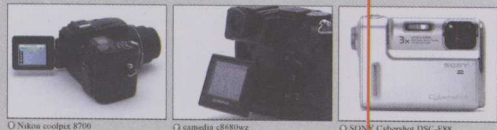
○ Nikon coolpix 8700

采用旋转式镜头或LCD的相机有何优势？它是把镜头或LCD可以自由旋转，拍摄角度不受限制的相机。如果女性朋友拍照，并且希望将女朋友的脸部拍的修长一些，那么就需要侧躺在地上从下往上拍摄。但是，如果您的相机的镜头或LCD是固定式的，那么您无需躺在地上，只需旋转一下您的相机的镜头或LCD，就能轻轻松松地获取所希望的效果。