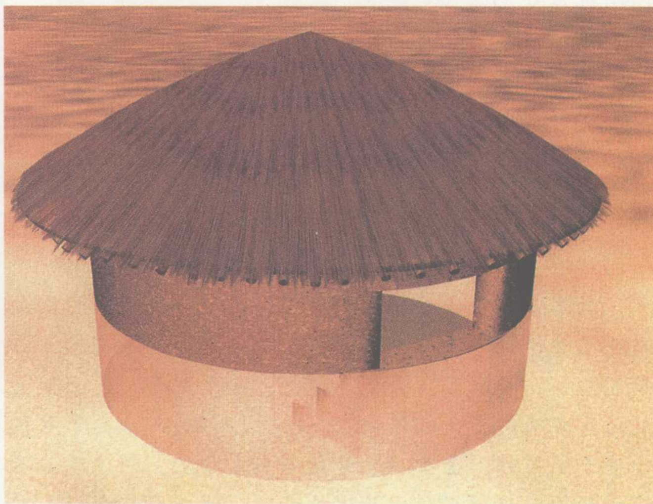
半地穴式圆形房屋模型

距今约7000年的华北裴李岗文化的石镰已经相当精致，与旧石器比较一下，有什么不同？