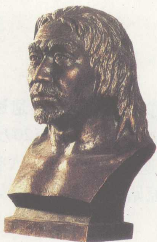
山顶洞人头部复原像