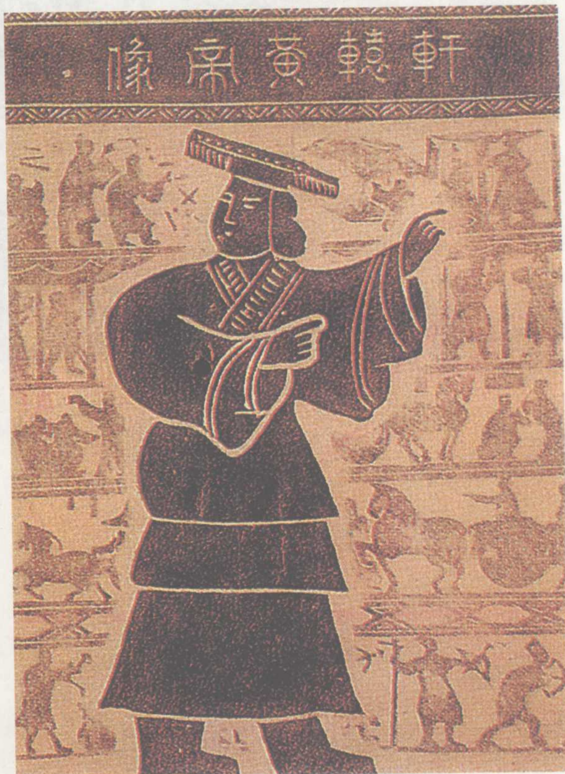
山东嘉祥县汉代画像石上黄帝像拓(tà)片

黄帝姬姓，轩辕氏，传说他发明了船和车，他的妻子嫫(léi)祖教民养蚕缫(sāo)丝，他的史官仓颉创造了文字。其他如历法、音律、宫室等相传也都是在黄帝时代发明的。