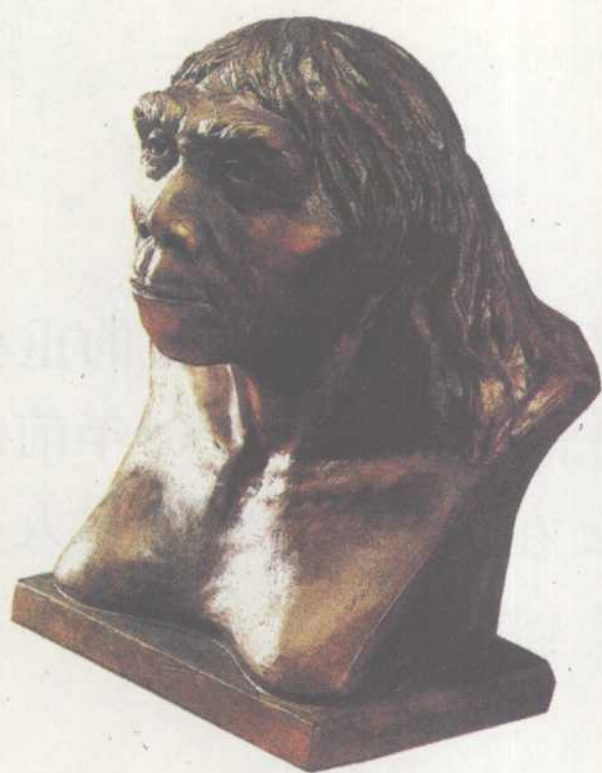
北京人头部复原像

由于是爬行，后肢要借助前肢的力量才能行走，因此猿类的大腿骨和上臂骨的长度基本相同。北京人的上臂骨则明显短于大腿骨，与现代人极为相似，表明北京人已经能够直立行走。猿在通过劳动向人类进化的过程中，手先获得发展，由此引起四肢的分化，最终完成了由爬行到直立行走的进化。