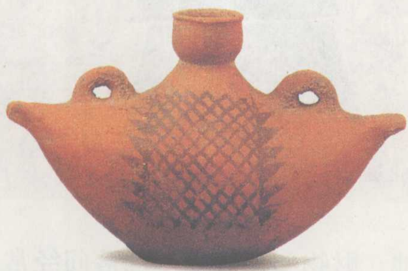
陕西半坡出土的船型陶壶