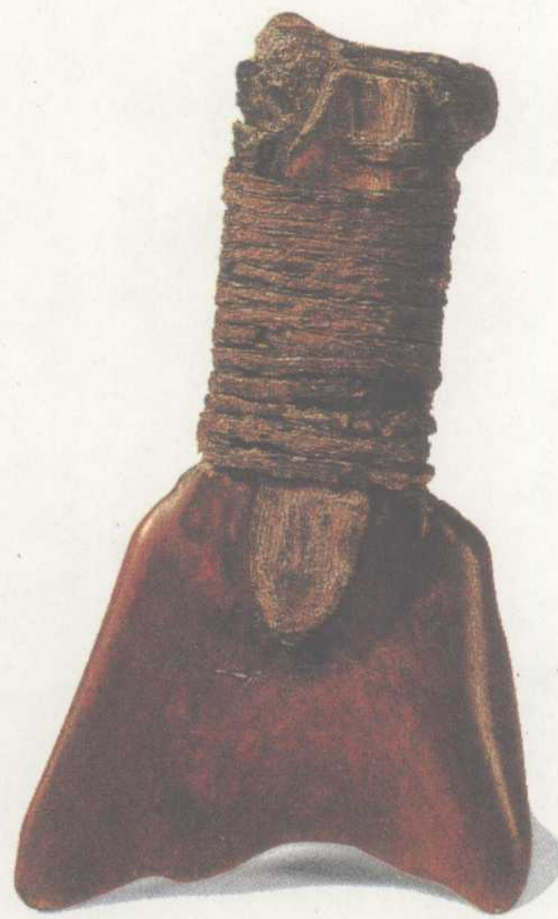
河姆渡遗址出土的骨耜(sì)

河姆渡遗址发现的稻谷粒很多依然保持原来的外形，经鉴定是人工栽培的粳(xian)稻。