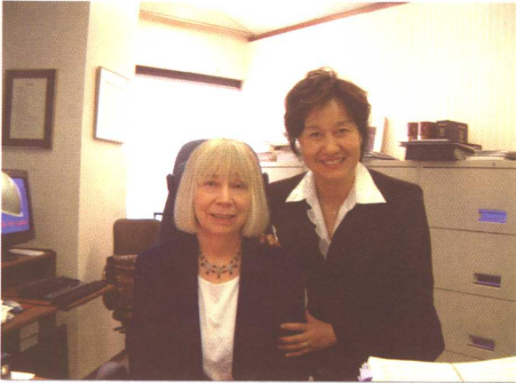
2005年,在加拿大温哥华,与不列颠哥伦比亚省检控厅帕特·唐纳德检控官交流后的合影。