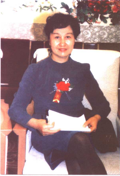
2005年4月29日,出席在人民大会堂举办的全国新闻人物“五一”座谈会并作大会发言