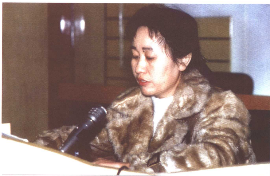
1998年1月20日，在中共本溪市纪律检查委员会机关党代会换届大会上做《工作报告》，时任机关党委副书记