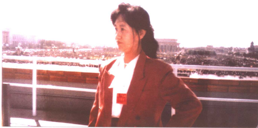
1993年10月1日参加全国总工会举办的劳模国庆观礼活动，登上天安门城楼