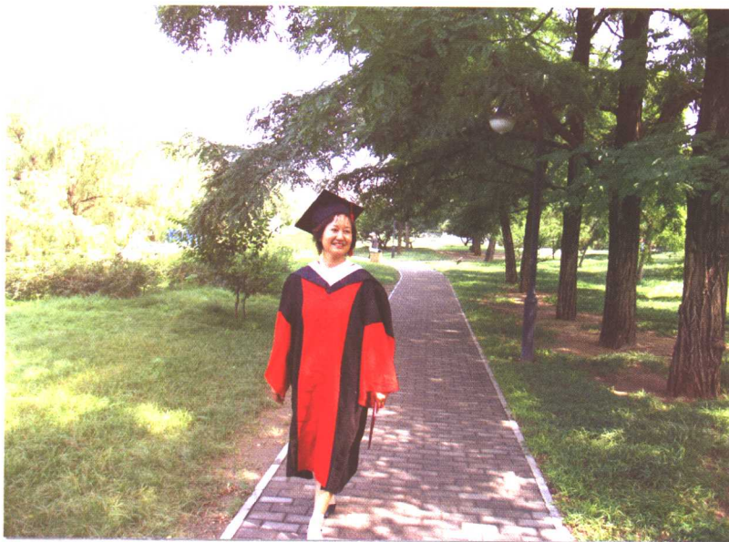
2006年6月30日在中国政法大学被授予法学博士学位