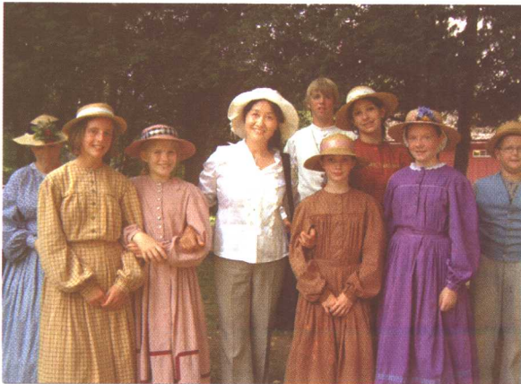
2005年,应加拿大刑法改革与刑事政策国际中心邀请,随国内考察团对加拿大刑事一审程序相关问题及加拿大落实《联合国反腐败公约》情况进行了考察。期间与国外小朋友在一起。