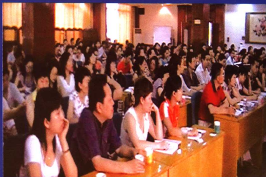
来自全国各地的作文教学高手，热情高涨地参加超级作文教学法培训。