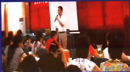
超级作文教学法课堂上，座无虚席。