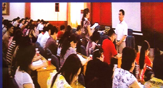
超级作文报告会，场场爆满。