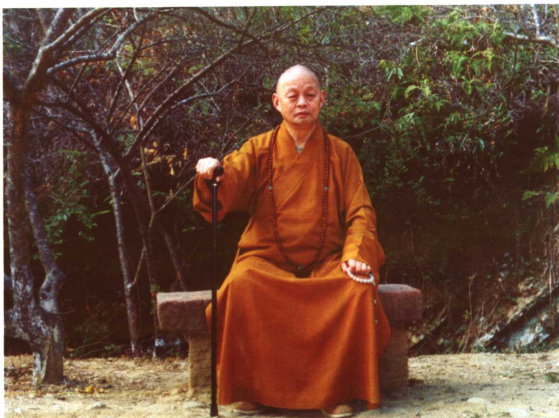
净慧法师（2004年秋摄于粤赣交界处大庾岭上之梅关古道，当年六祖初次说法于此。）