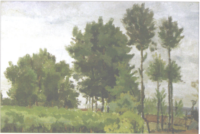
图2 树冠形态——圆球体