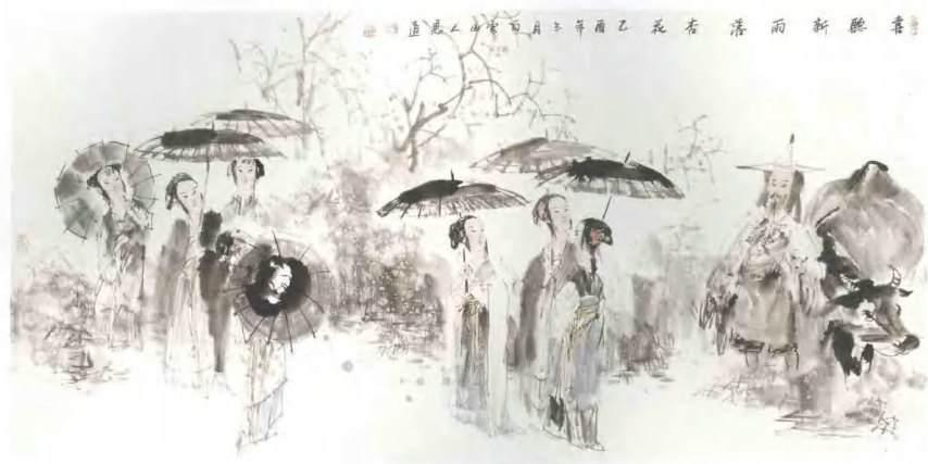
雨落杏花 2006年 纸本水墨 68cm x 138cm