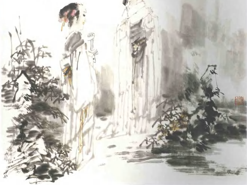
清風圖 2006年 紙本水墨 68cm x 56cm