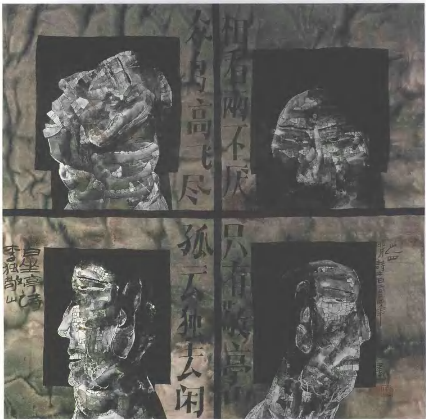
残像之1 2004年 纸本水墨 68cm x 68cm