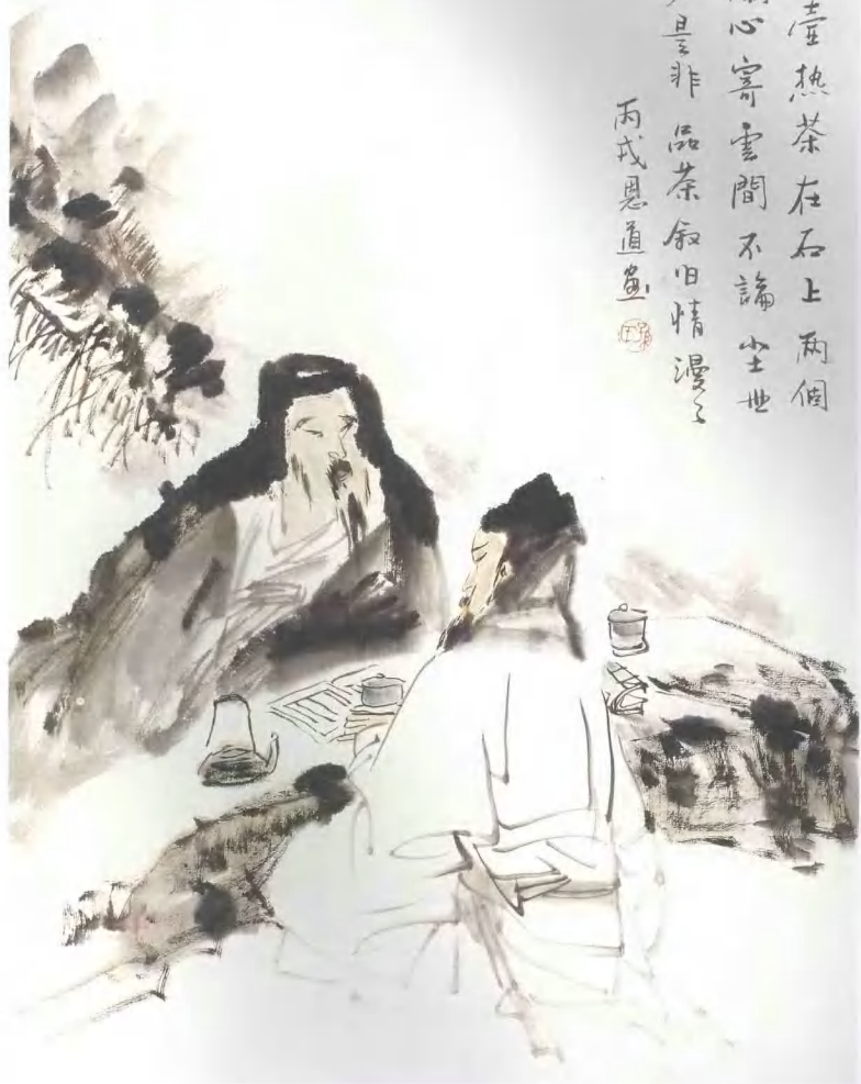
人物 2006年 紙本水墨 Bilam x Bilam