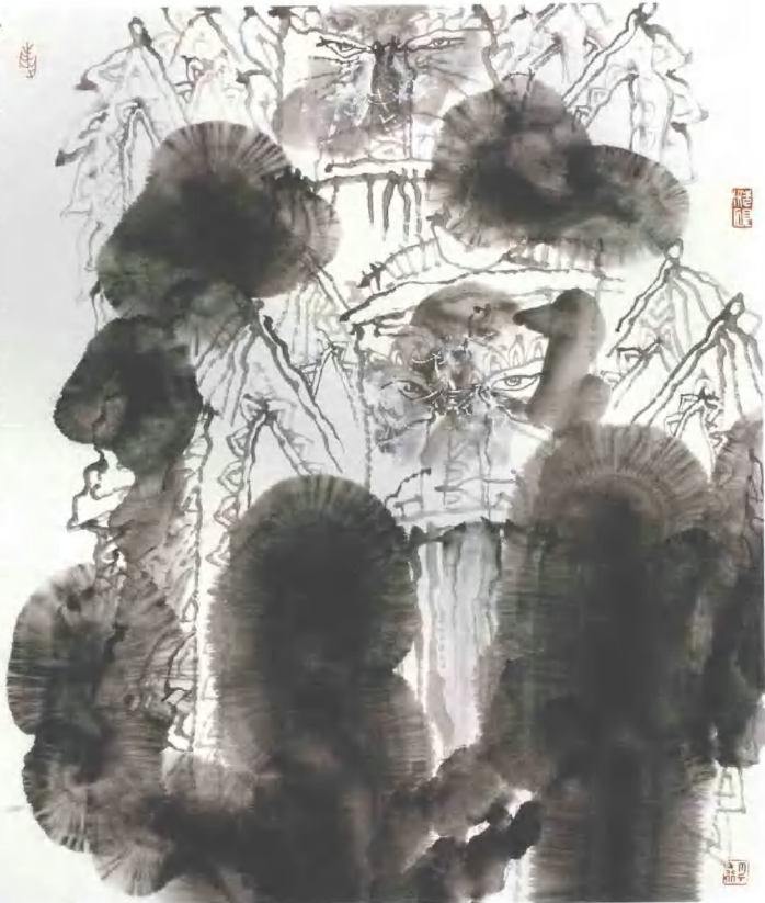
戏曲人物之2 2006年 纸本水墨 68cm x 68cm