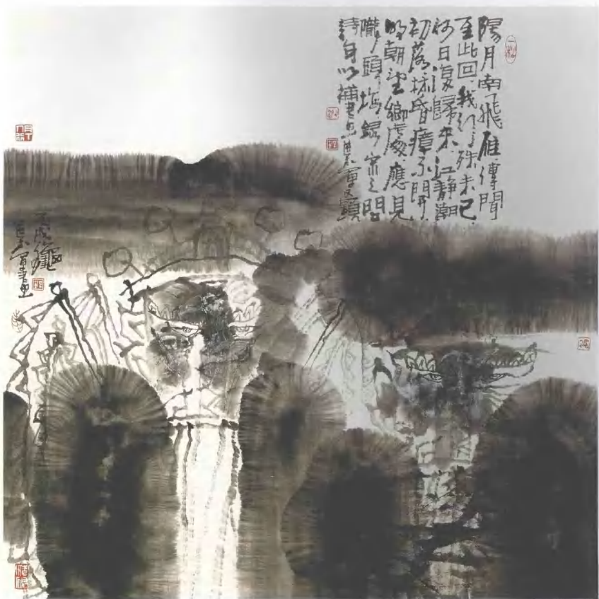
戏曲人物之1 2006年 纸本水墨 88cm x 88cm