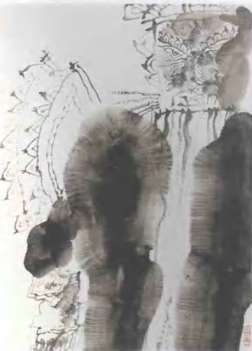
戏曲人物之3 2005年 纸本水墨 68cm x 88cm

時難之走荒世業小生弟兄 國家之為干戈後骨肉流離 今為子空雁辭規前作北 應也旅一在柳心身遠同 畫 許江丙戌三月歲在癸巳 葉寧