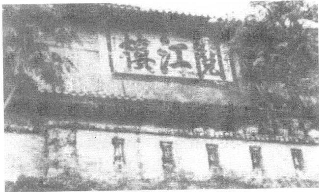
独立团团部设在肇庆市，图为独立团旧址——肇庆阅江楼。

1926年的四五月间，地处广东西江的肇庆有着很好的景致。在这春夏之交的日子里，肇庆那被称为“英雄花”的木棉花，连村接野，无处不开。在亮丽的阳光下，红棉花一团团，一簇簇，鲜红似火灿烂异常。就在这美好的日子里，一天，担任国民革命军第四军独立团团长的叶挺，在肇庆团部突然接到了来自中共广东区党委和四军军部的同一内容的两个通知，要他立即赶到广州后，领受光荣的北伐先遣队的战斗任务。