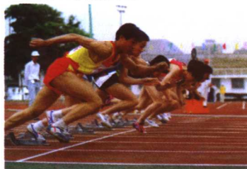
▲首都体育学院田径比赛