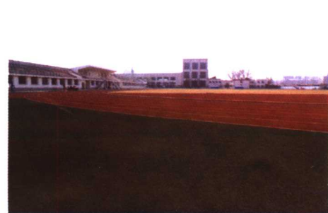
▲首都体育学院田径场