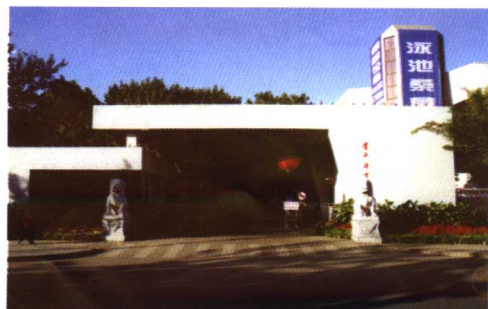
▲首都体育学院校门

首都体育学院建于1956年，现已培养了上万名各类体育专业人才。学院位于海淀区北三环西路，南北两个校区共占地367亩。校园内建有大学生体育馆、田径综合馆、游泳综合馆、球类综合馆、篮球馆、体操馆、足球场、塑胶田径场等大型体育设施达5万多平方米。曾先后承办了第11届亚运会、第6届远南运动会、第7届全运会、第6届全国少数民族传统体育运动会、第21届世界大学生运动会等大型国际国内综合运动会的部分竞赛项目。各类体育场馆除保证日常的教学和训练任务外，坚持常年对社会开放，为全民健身运动的开展服务，每年接待健身锻炼人数30余万人次。