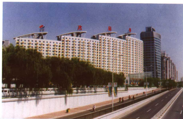
首钢建设公司承建的21届世界大学生运动会运动员公寓