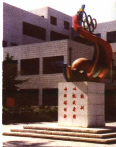
▲首都体育学院图书馆