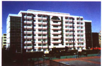
▲首都体育学院公寓