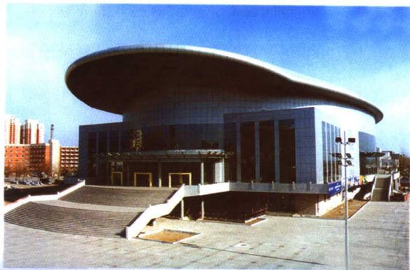
北京首钢篮球中心全貌

北京首钢篮球中心的建设得到了社会广泛的支持与帮助，在此表示感谢！同时也诚邀各界朋友加盟合作，共创北京体育产业的美好明天。