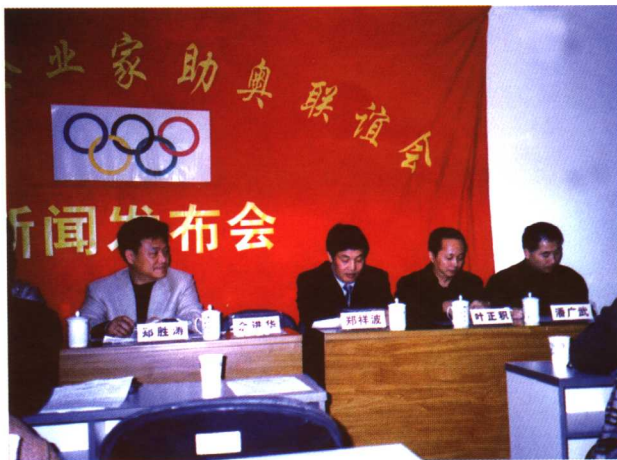
▲温州市企业家助奥联谊会成立

2001年7月13日北京申奥获得成功，一封来自北京2008年奥运会申办委员会的信函发到了温州市人民政府，来函说：“温州市人民政府：北京申办2008年奥运会期间，得到了你市各界的大力支持，特别是由你市发起组织的“温州—深圳—香港汽车拉力活动”，为北京成功取得2008年奥运会举办权作出了贡献，现悉你市将组织“温州市企业家助奥联谊会”，特致函表示支持。并希望该联谊会能继续发扬“温州人精神”，保持与北京2008年奥运会组织委员会的联系，为2008年北京办出一届出色的奥运会给予支持和作出贡献。”