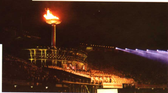
首钢建设公司承建的第21届大运会火炬台

2002年4月29日国际奥委会协调委员会主席韦尔布鲁根先生一行在北京奥组委副主任委员刘敬民副市长的陪同下，来到首钢篮球中心考察，对于首钢篮球中心的一切给予了充分的肯定，北京市确认为2008年奥运会第一个比赛场馆。