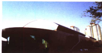
▲首都体育学院游泳馆