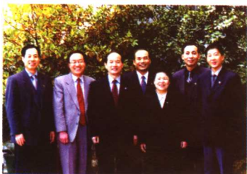
▲首都体育学院现任领导班子