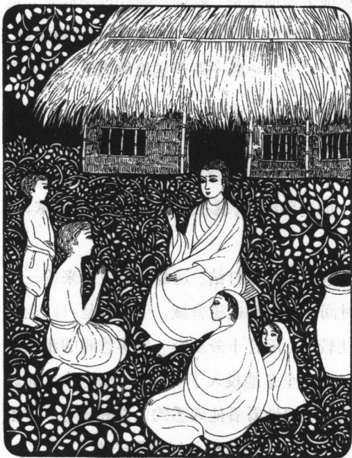
佛陀坐在缚悉底屋外的小凳上。