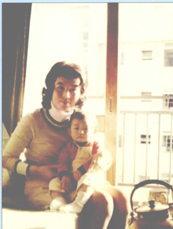
第一个属于自己的家