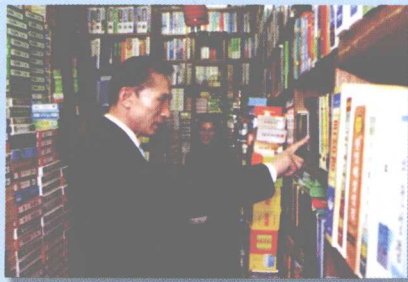
清溪川附近的旧书店