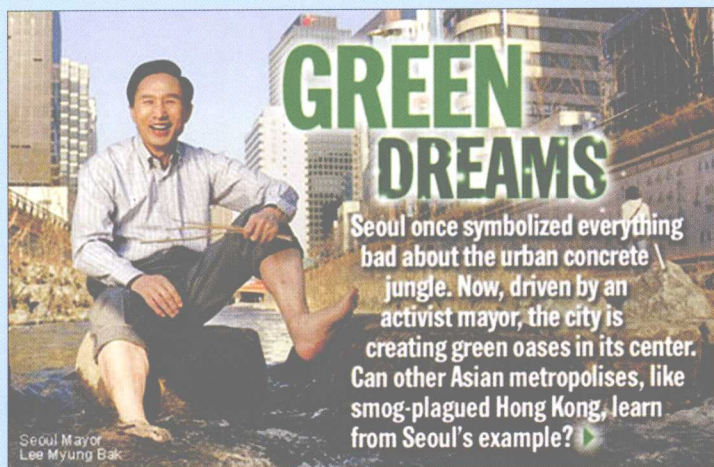
美国《时代》杂志介绍清溪川