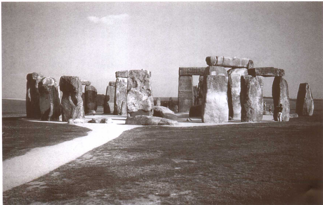
图 1.3 英国，索尔兹伯里，石环，约公元前 2750—前 1500 年

法国建筑理论家和历史学家维奥莱·勒·迪克（Eugène-Emmanuel Viollet-le-Duc, 1814—1879 年）在 1876 年出版了他的专著《历代人类住屋》（The