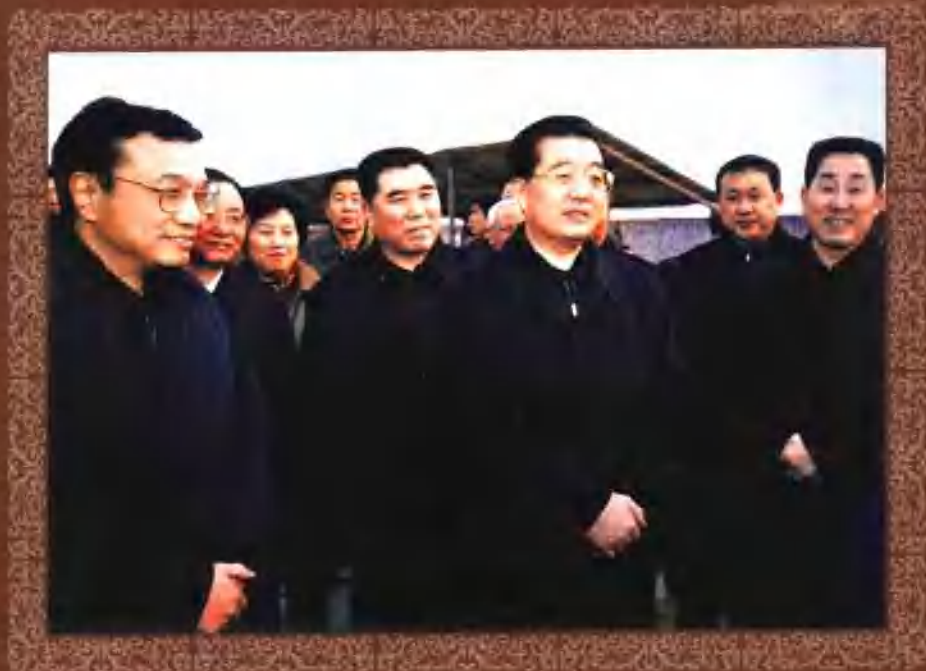
2003年12月中共中央总书记、国家主席胡锦涛在河南省虞城县视察工作，时任中共河南省委书记李克强（左一）、河南省省长李成玉（右四）、中共商丘市委书记刘满仓（右一）、中共虞城县委书记张新（右二）陪同视察