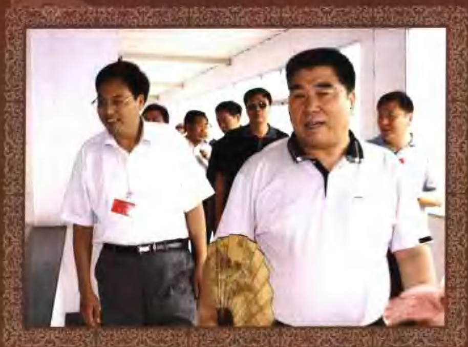
2006年7月李成玉省长在虞城县视察工作，县长王清辰(左一)陪同视察