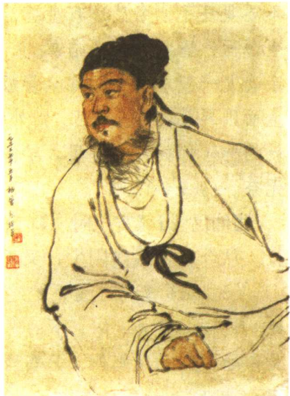
关汉卿画像 李斛 绘

(冲末 ⑨ 扮窦天章引正旦 ⑩ 扮端云上,诗云)读尽缥缃万卷书,可怜贫煞马相如,汉庭一日承恩召,不说当垆说子虚 ⑪ 。小生姓窦名天章,祖贯长安京兆 ⑫ 人也。幼习儒业,饱有文章;争奈 ⑬ 时运不通,