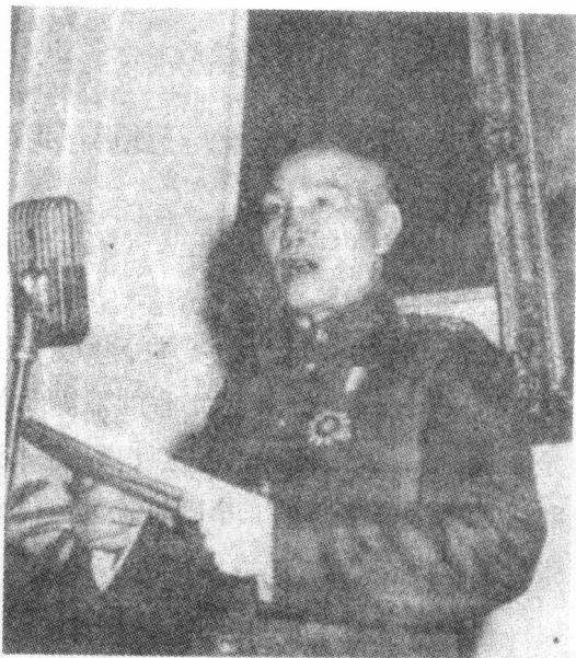
蒋介石在发表讲话