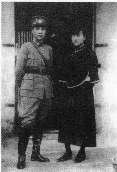
1926 年蒋介石与夫人陈洁如