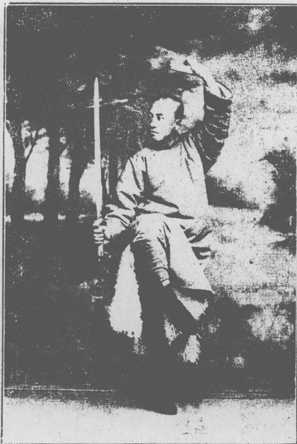
影 近 樵 容 姜