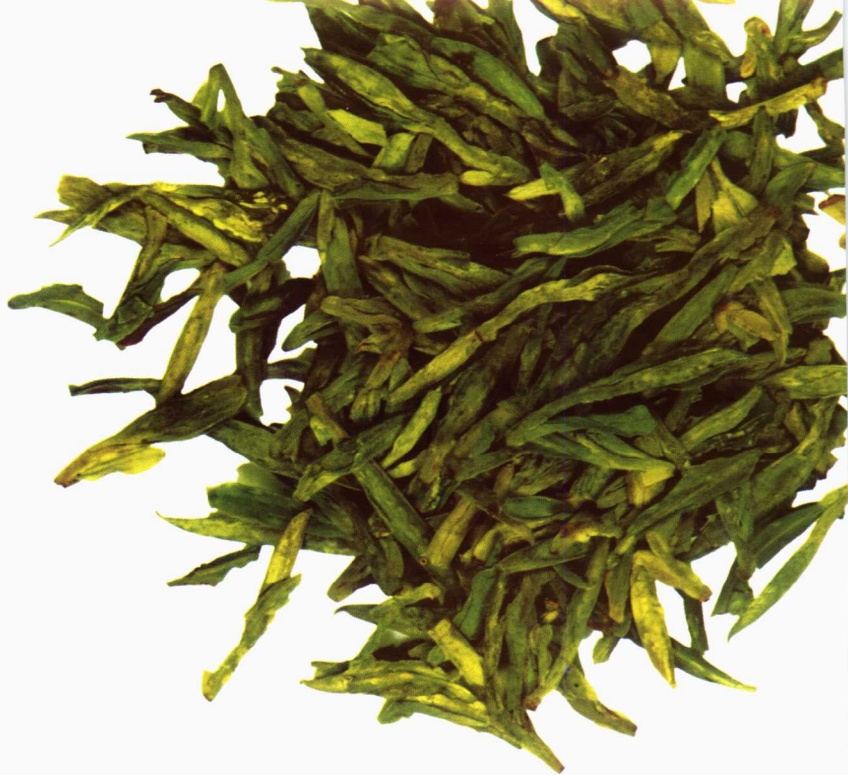
绿茶的主要产地和当地名茶