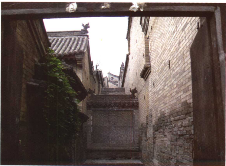
晋商大院