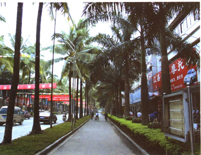
彩图 5-2 云南景洪市景洪路