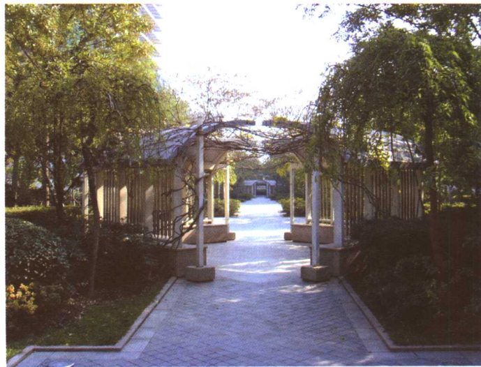
彩图 5-7 上海世纪大道