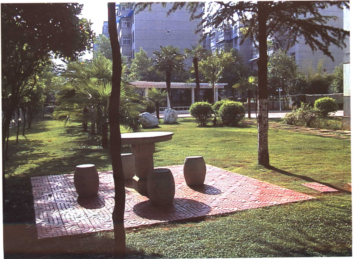
彩图 7-2 西南林学院生活区小游园