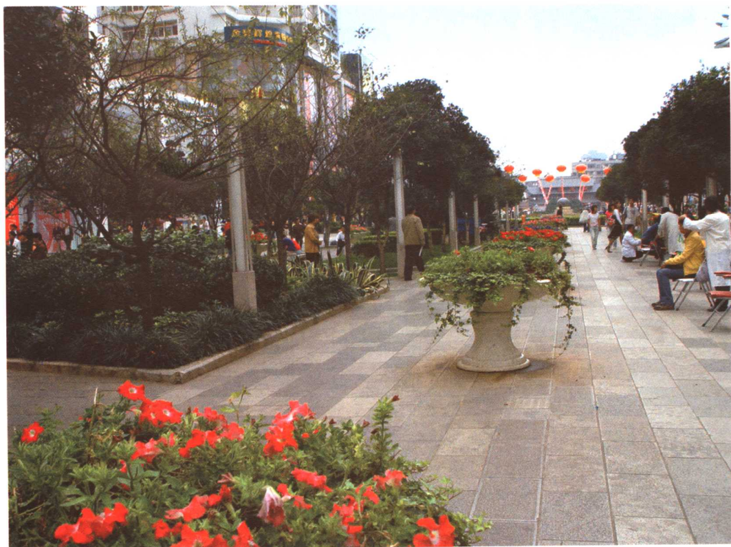
彩图 5-12 昆明步行街