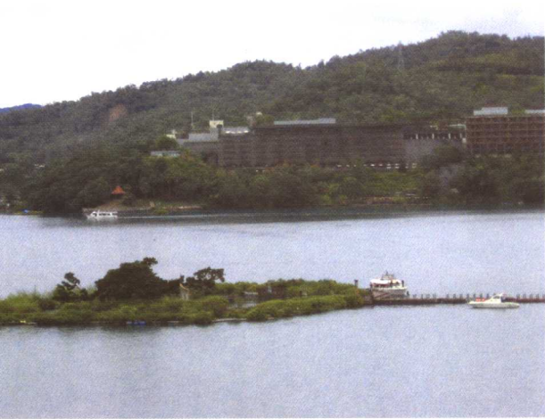
彩图 5-16 台湾生态浮岛