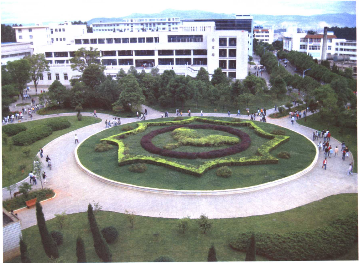
彩图 7-1 西南林学院教学区