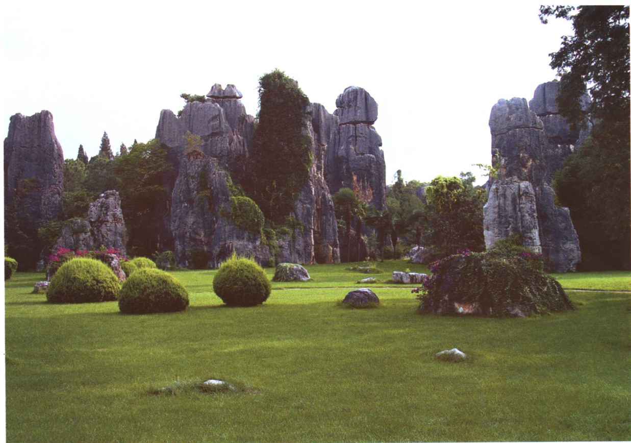
彩图 10-1 石林风景区一景