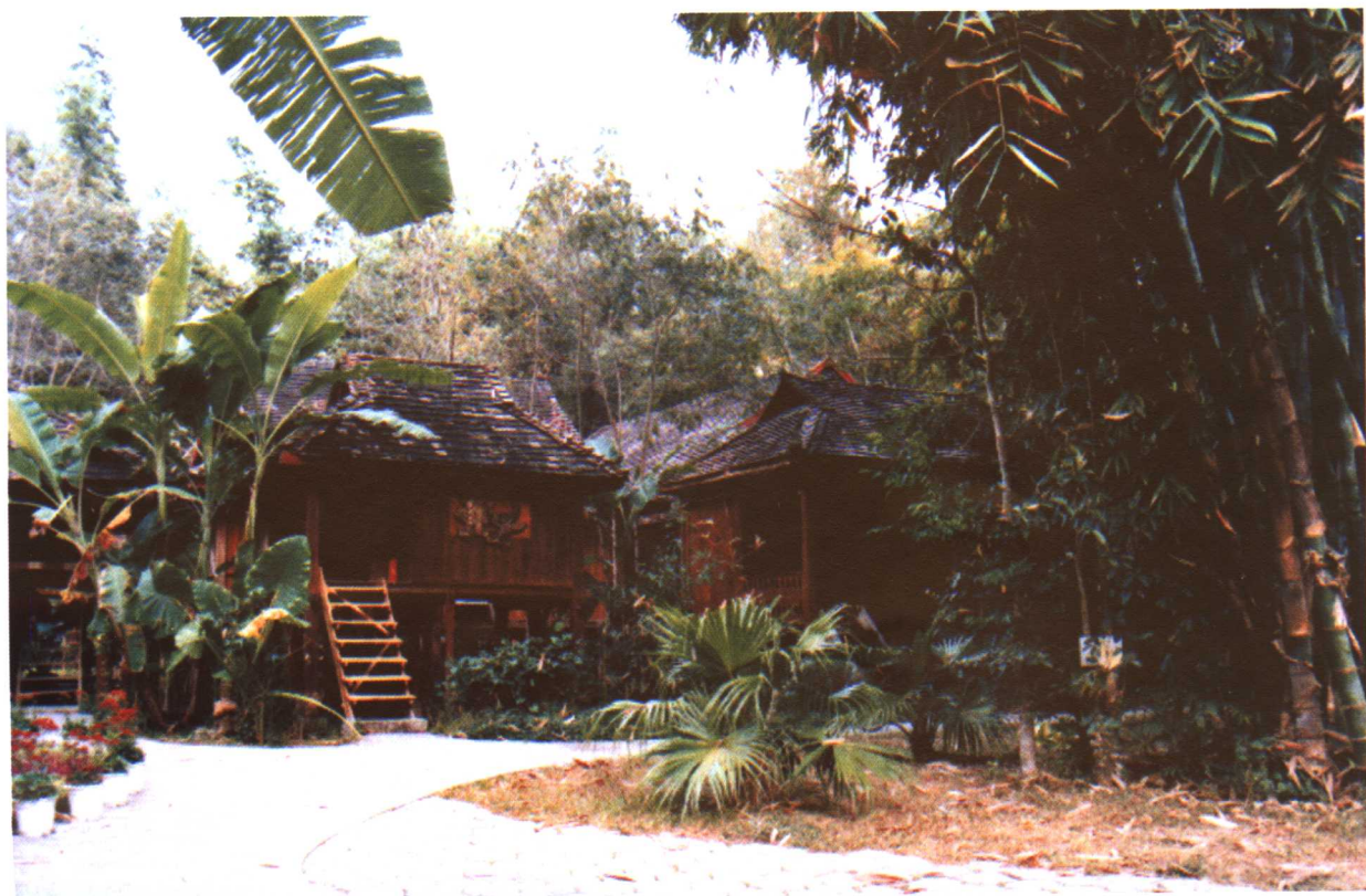
彩图 10-2 西双版纳打洛森林公园宾馆区