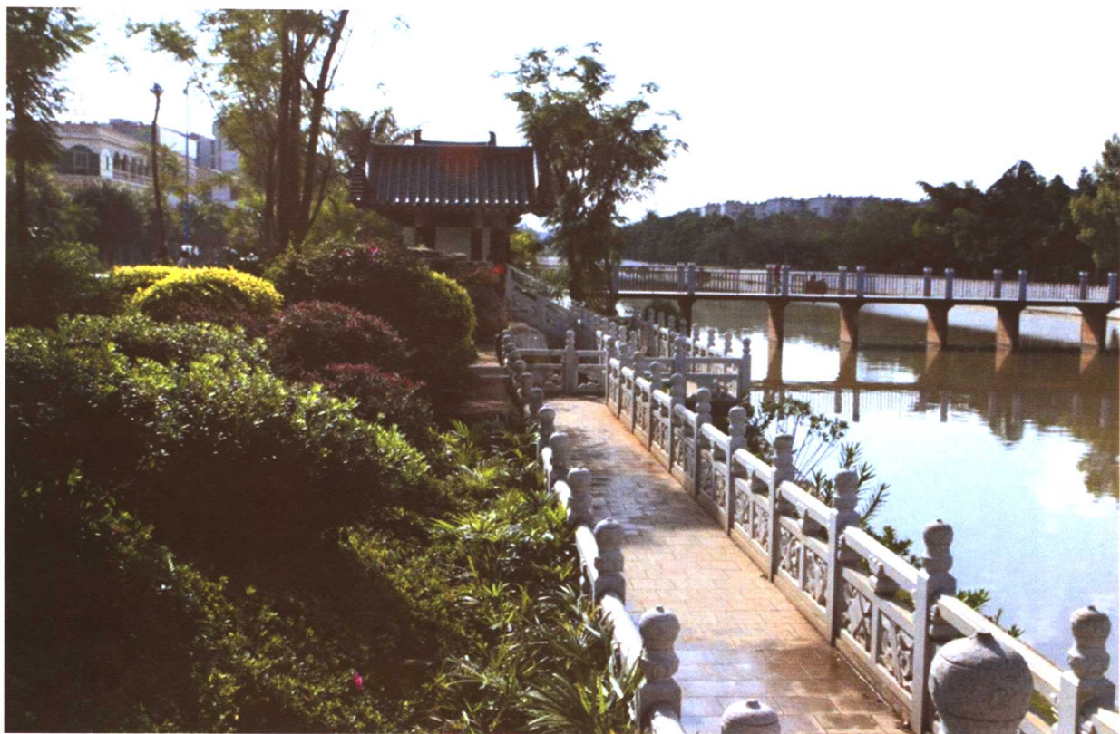
彩图 5-14 云南开远滨河绿地