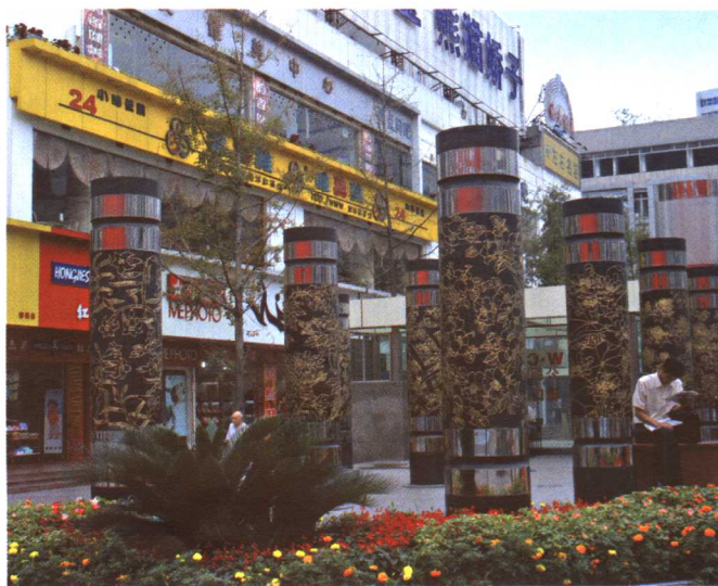
彩图 5-11 成都春熙路商业步行街