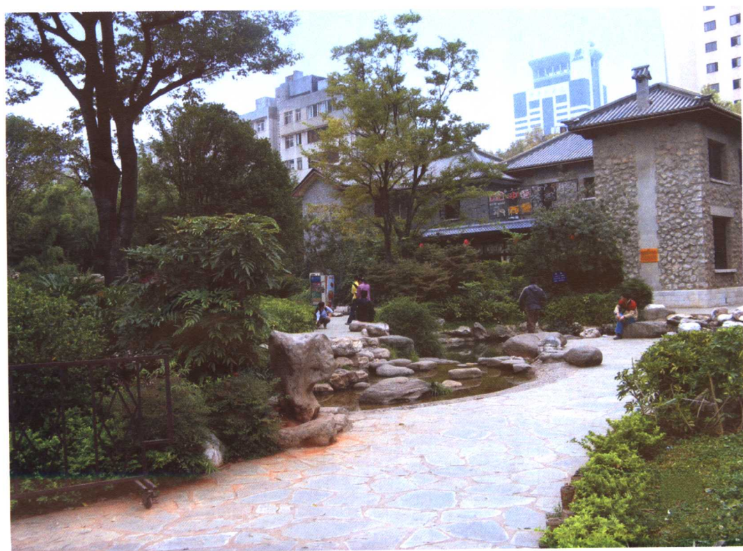
彩图 5-13 昆明街头小游园——茶花公园