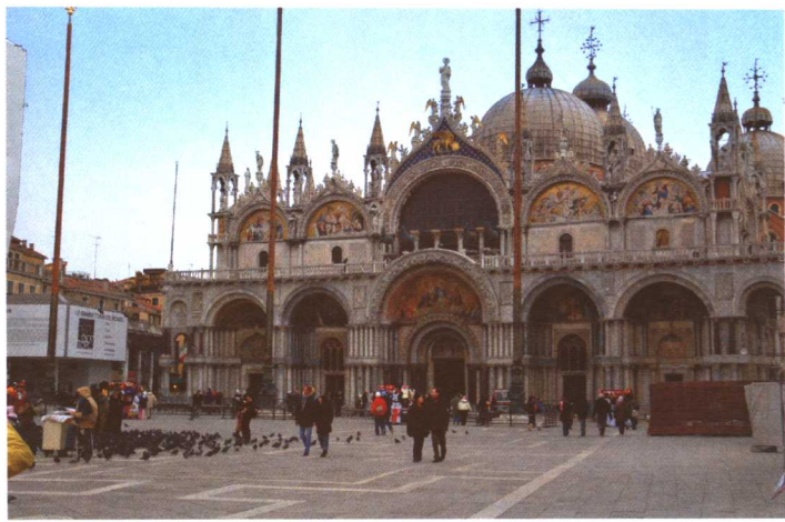
彩图 6-1 意大利圣马可广场