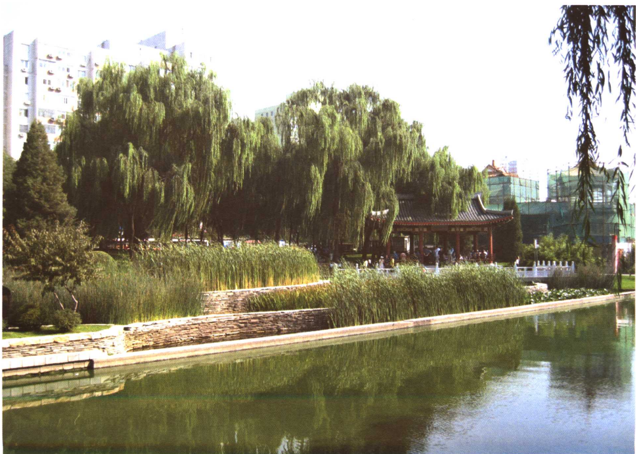
彩图 5-15 北京元大都遗址公园湿地技术