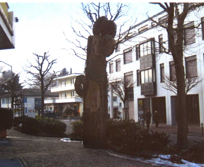
彩图 5-10 欧洲某城市街头小品与绿化