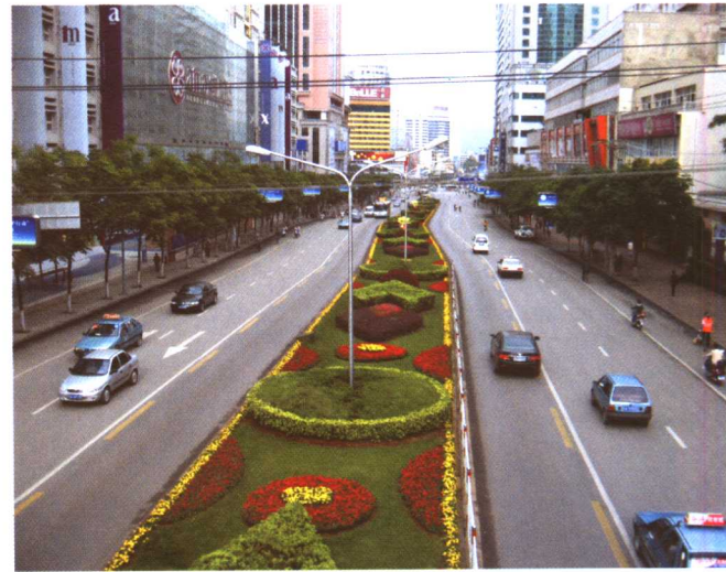
彩图 5-3 昆明武成路道路绿化