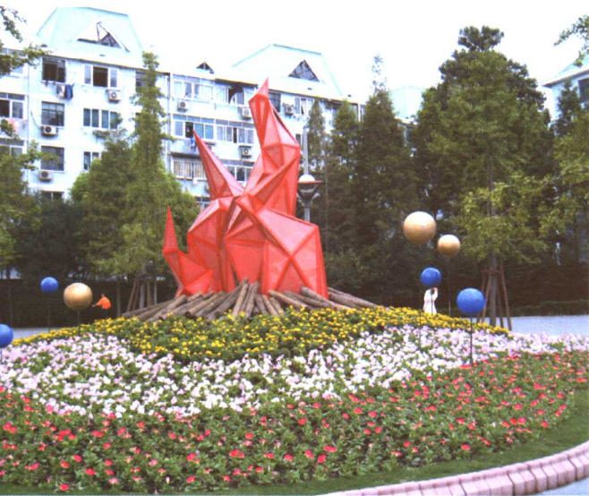
彩图 5-8 世纪大道 街头装饰绿地