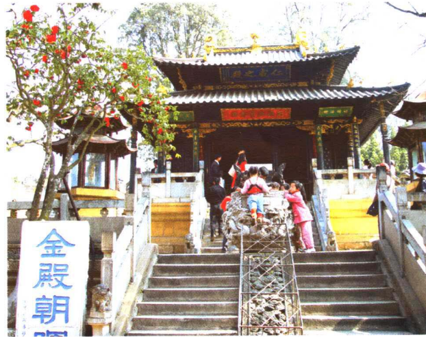
彩图 4-7 昆明金殿