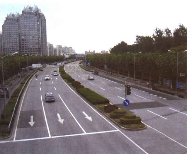
彩图 5-6 上海世纪大道