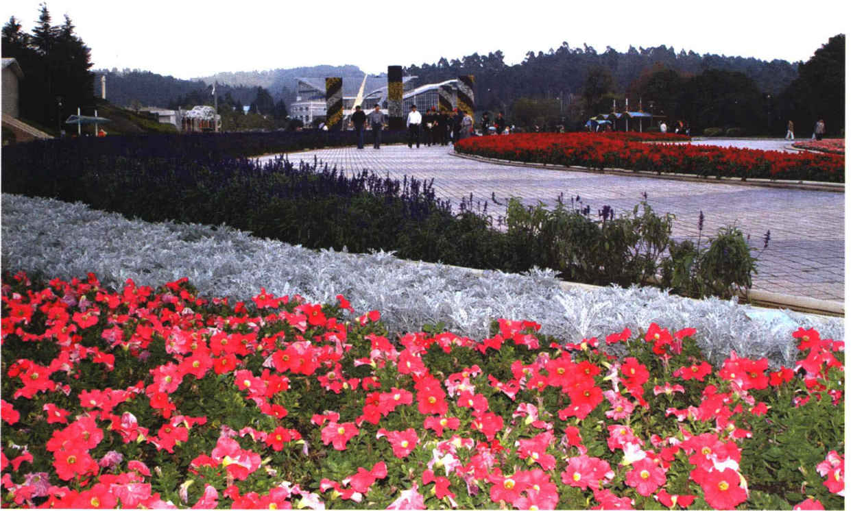
彩图 4-1 世博园花坛