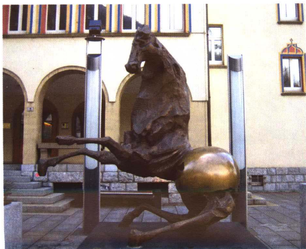
彩图 4-6 欧洲某城市街头雕塑