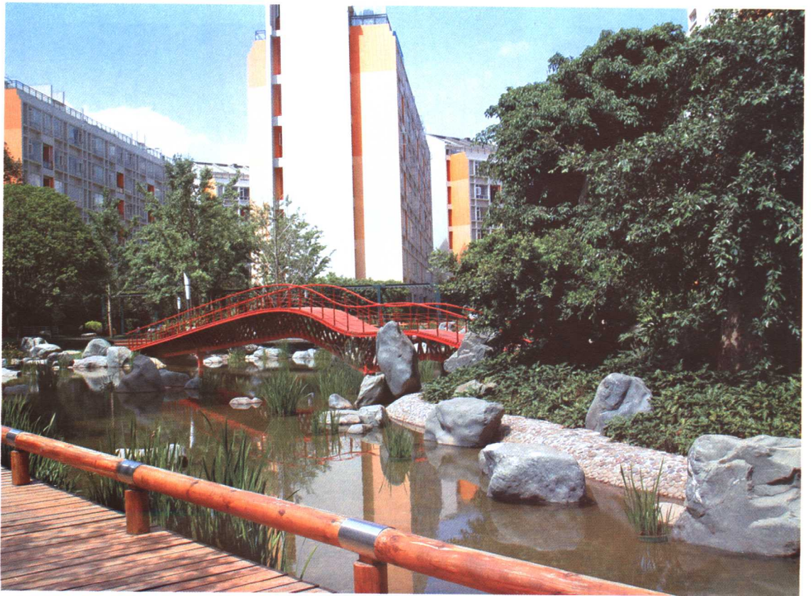
彩图 8-2 昆明某居住区水景