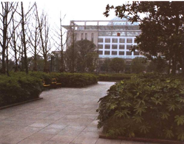
彩图 6-2 贵阳新区城市广场绿化