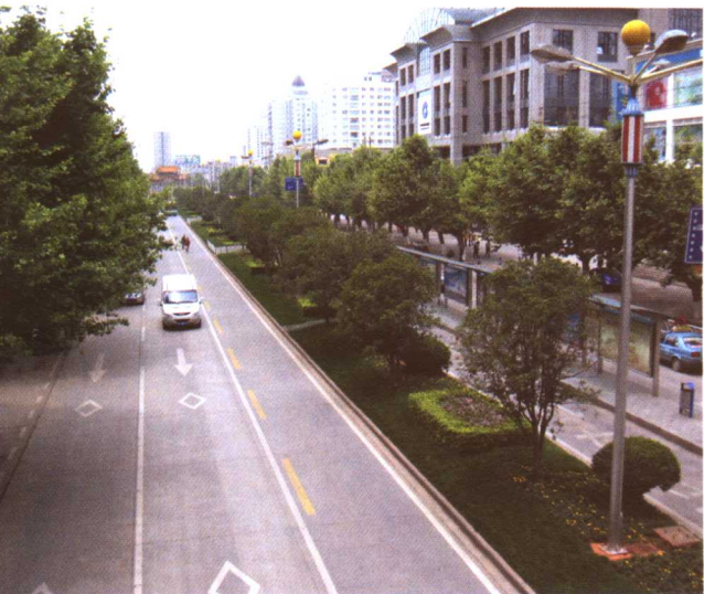
彩图 5-4 昆明金碧路