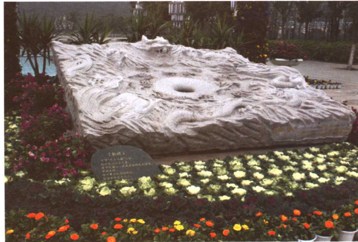
彩图 6-3 贵阳新区城市广场入口小品