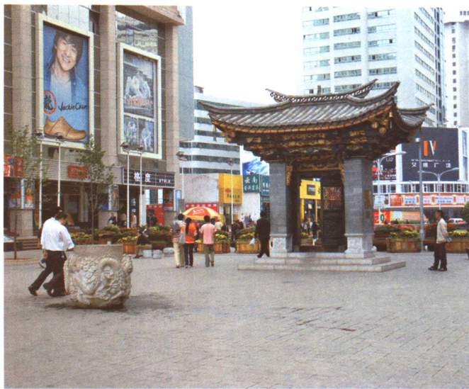
彩图 5-9 昆明文化步行街