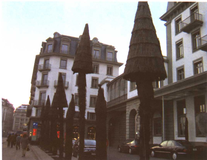
彩图 5-5 欧洲蜜月小镇道路绿化