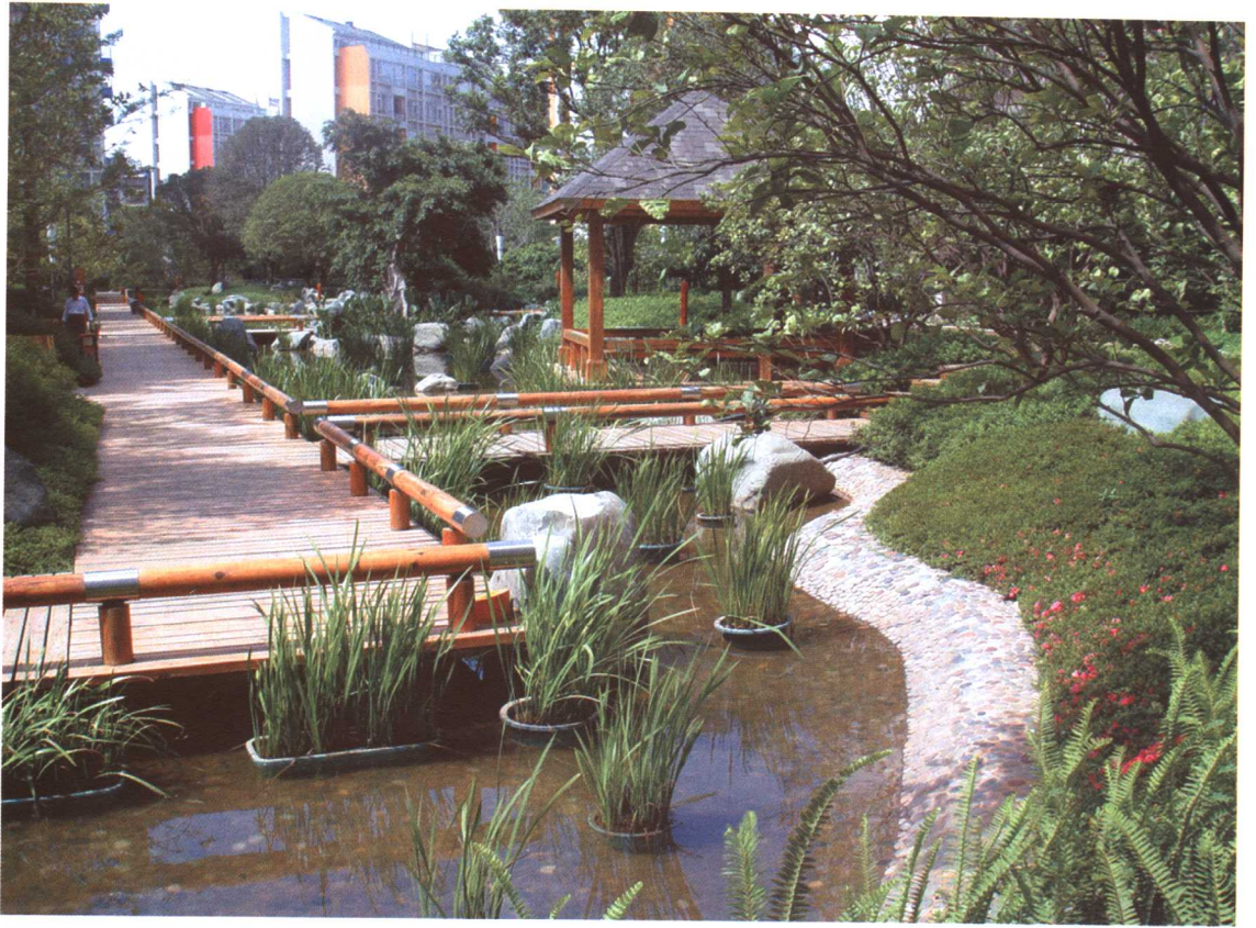
彩图 8-1 昆明某居住区水景