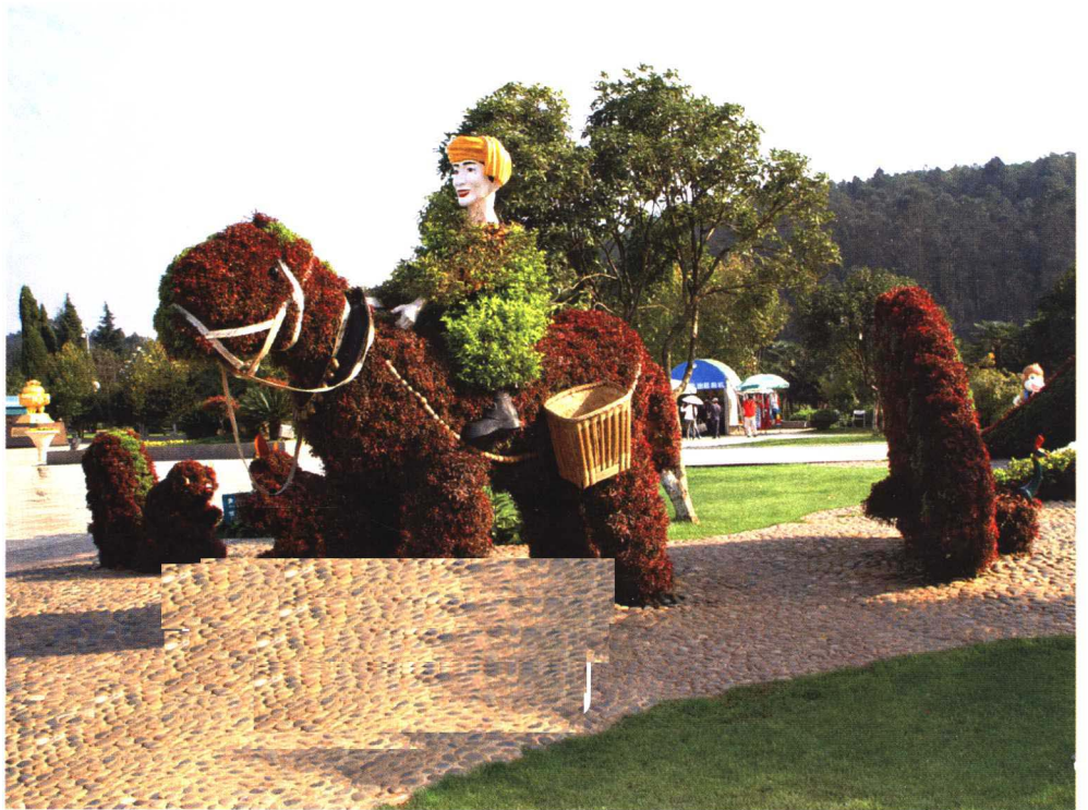
彩图 4-2 世博园立体花坛