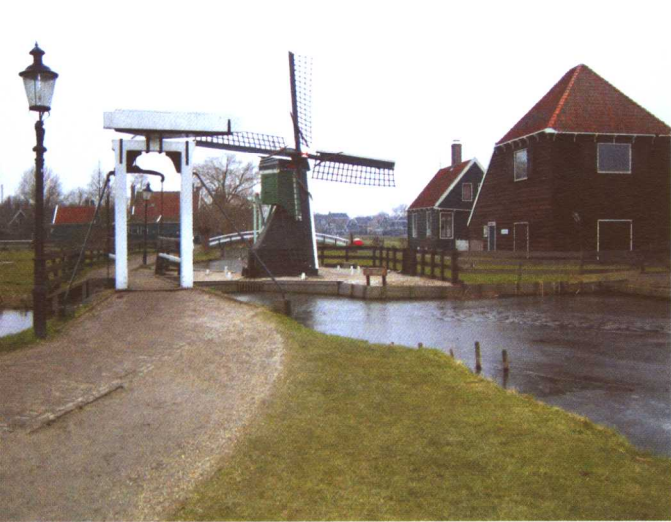
彩图 4-8 荷兰风车村