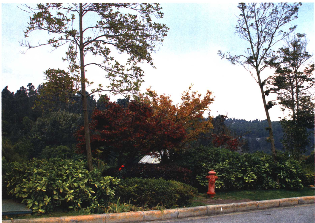
彩图 4-3 世博园道路绿化 1