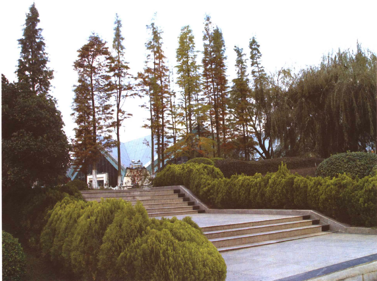
彩图 4-5 世博园水边植物配置