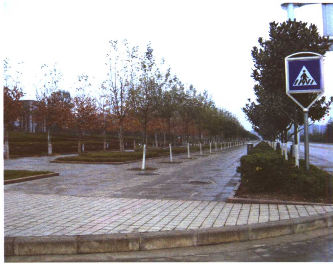
彩图 5-1 贵阳金阳大道