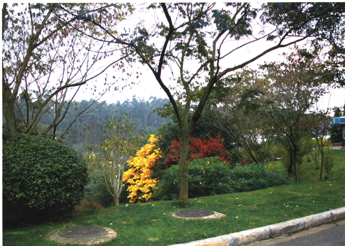
彩图 4-4 世博园道路绿化 2