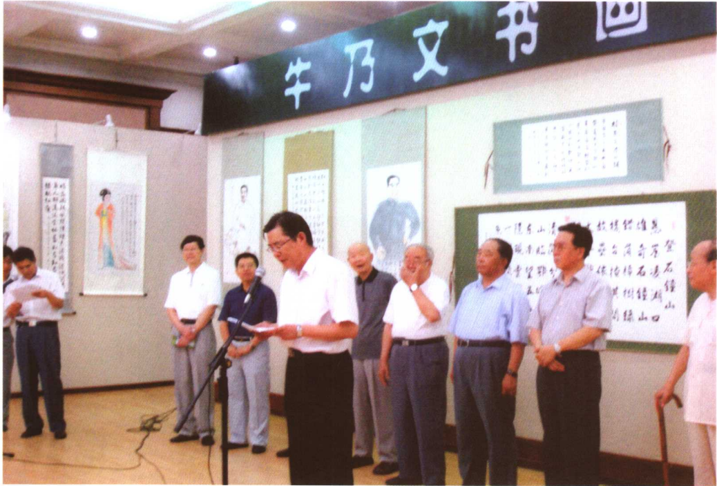
市委常委、宣传部长朴逸同志讲话