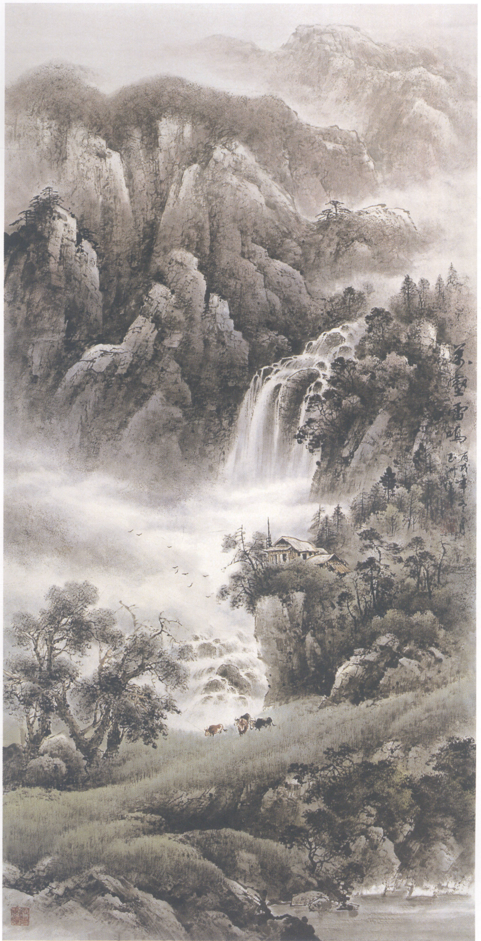
万壑雷鸣 138 x 68cm