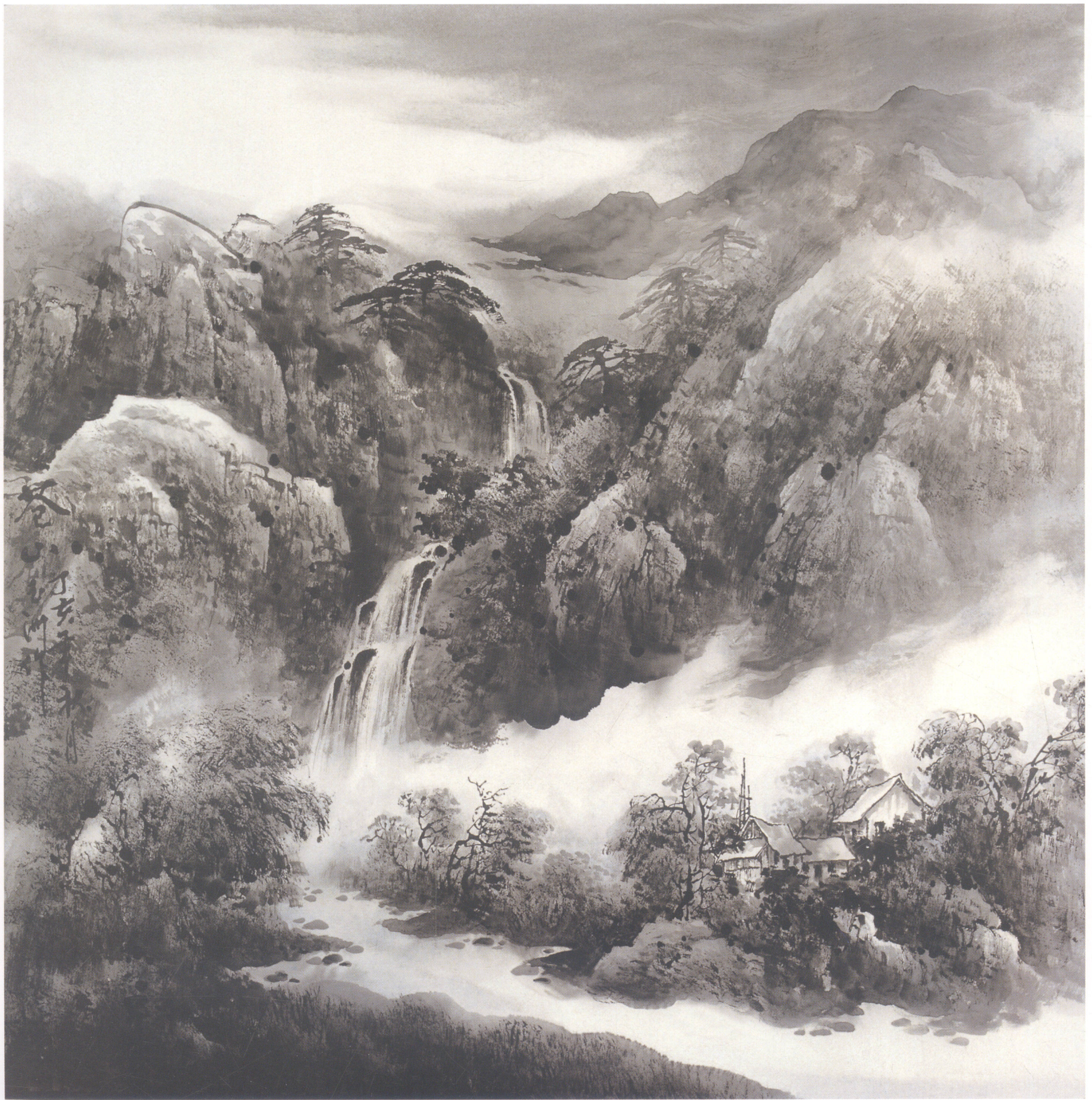
苍山 90×90 cm