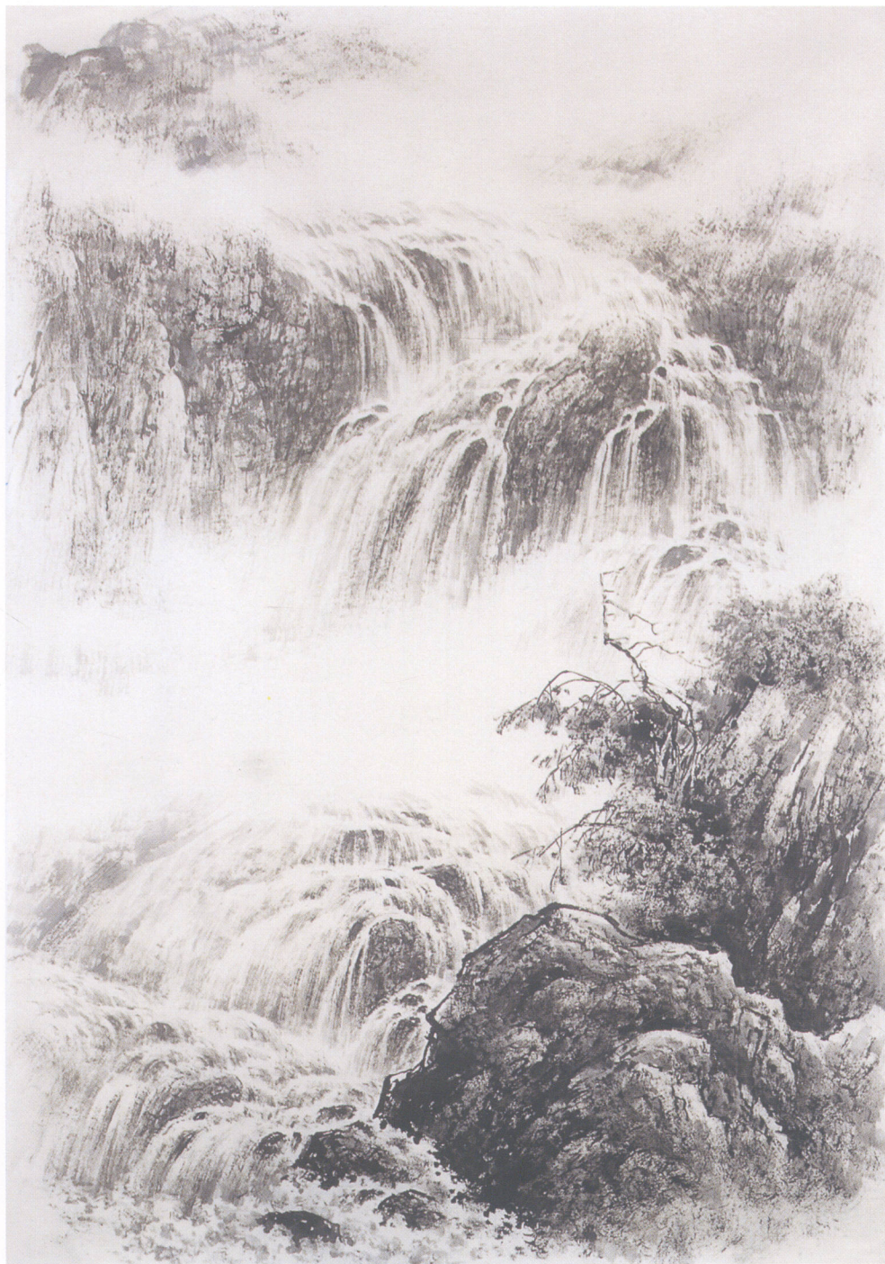
图例二：《奔流》画法步骤

1. 这是表现云与水的画法。首先把握好云和水的关系，即云中有水，水中有云，画面呈现虚无飘渺变幻无穷的自然景观。