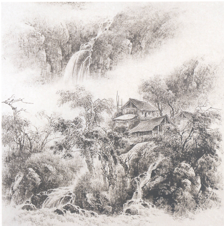
图例一：《野寨》画法步骤

1.这是表现少数民族山中小寨的景点。古寨依山傍水，山水相依，十分幽静，让人想往。画时，用狼毫笔中墨勾出山石、树木、房屋。注意山石皴擦和明暗关系，远山用云雾隔开，显得更远。