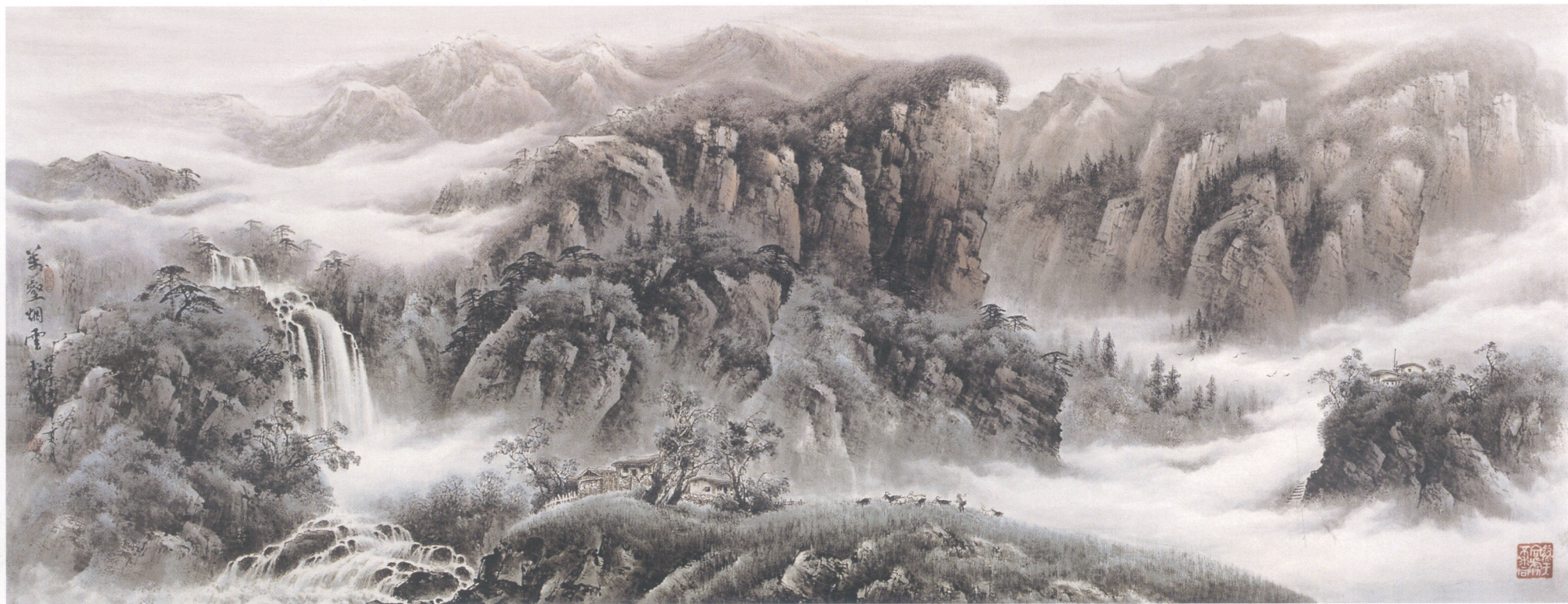
万壑烟云 240 × 100cm