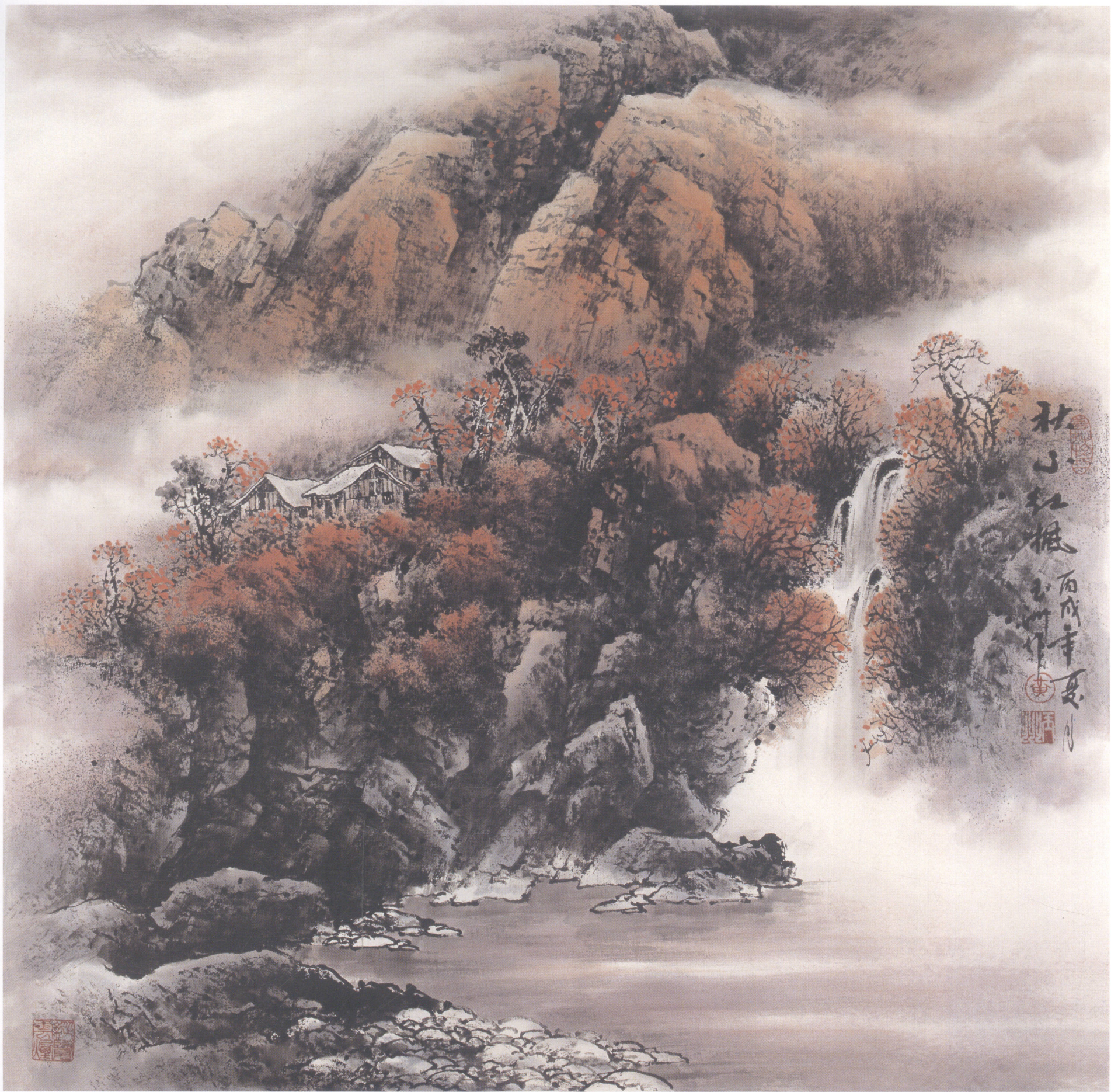
秋山红枫 90 × 90cm