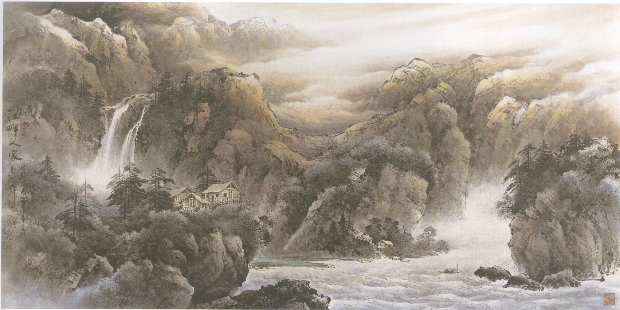
江畔人家 138 x 68cm