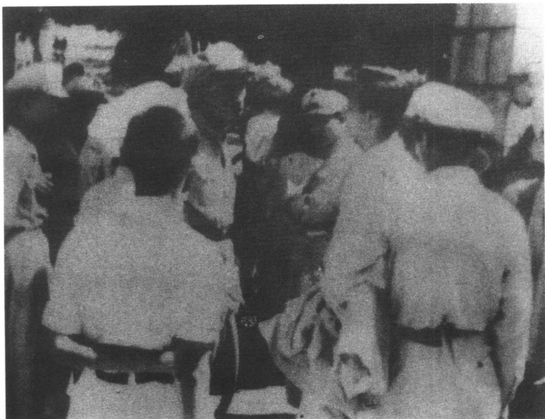
8月19日反动军警包围北大的情形