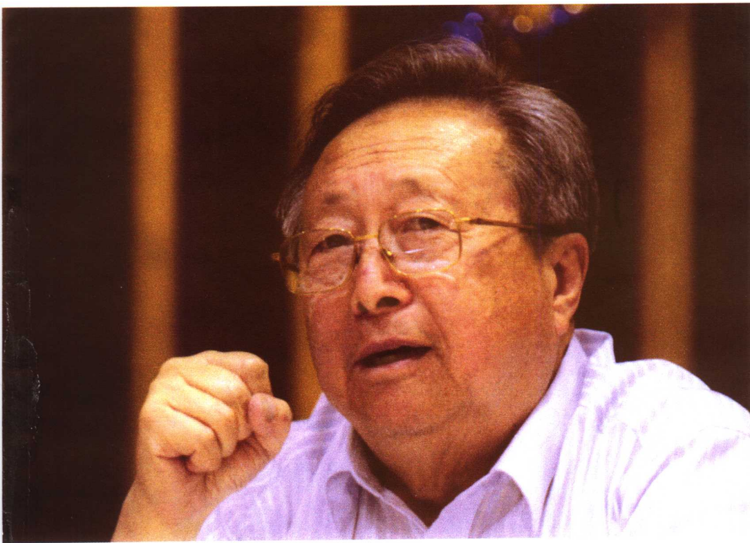
2007年5月作者80岁寿辰时摄，距离出狱已有50多个年头