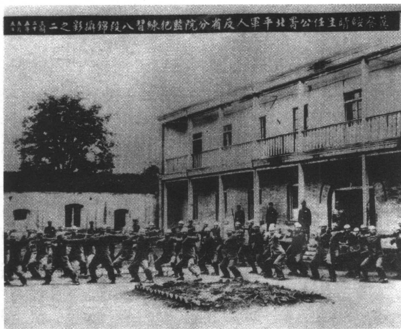
被囚禁在草嵐子监狱中的革命者在院中做操