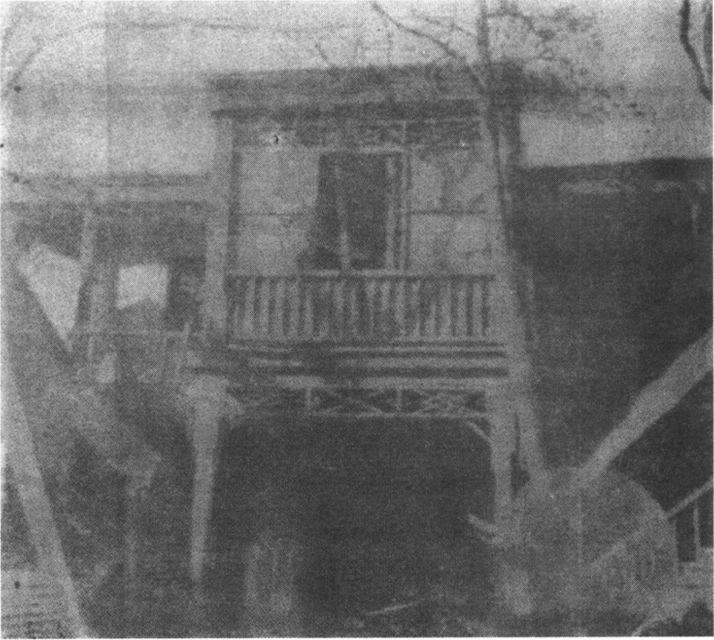
草岚子监狱遗址之一：原特刑庭看守所当局办公楼，位于监狱中央