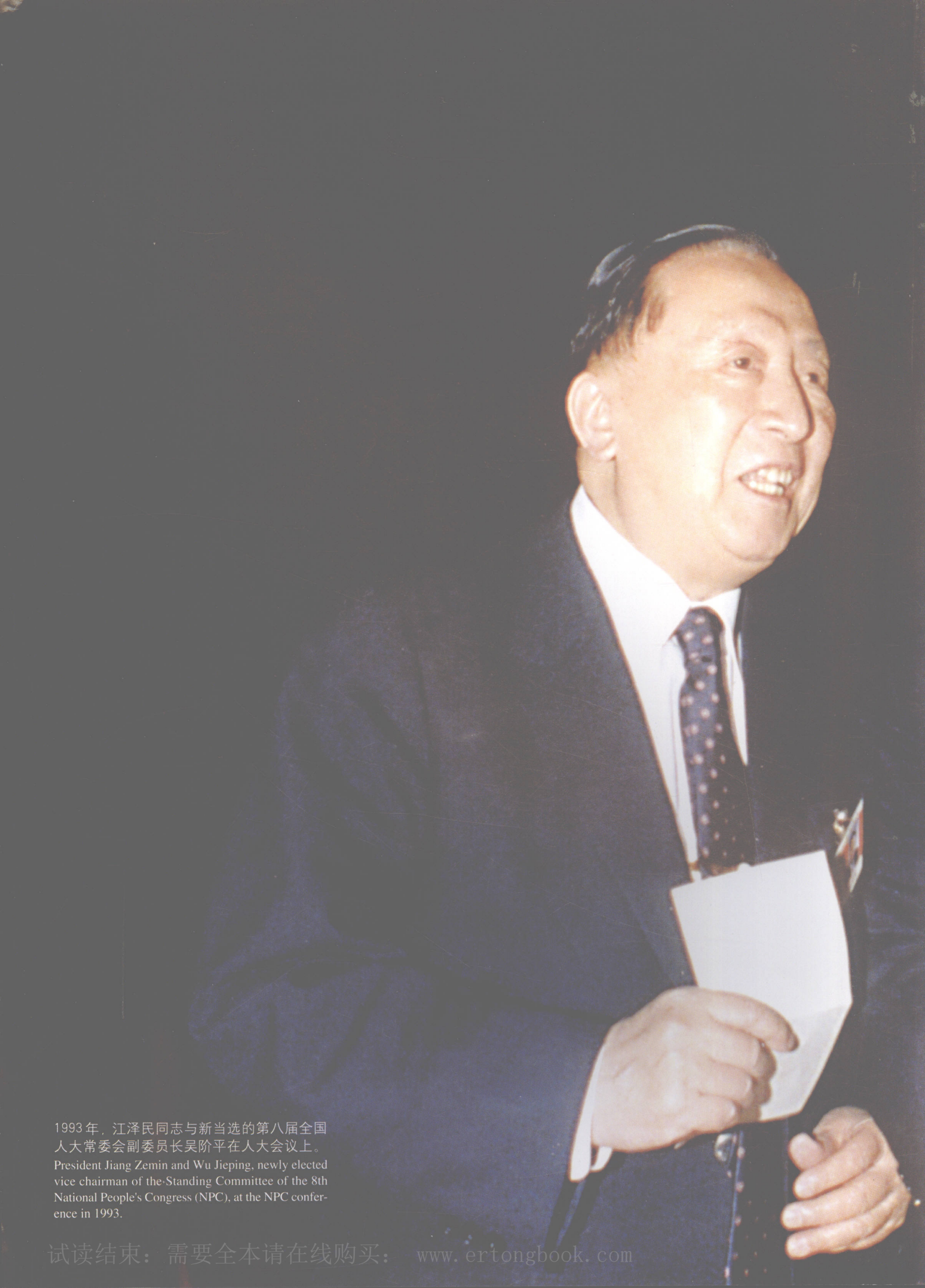
1993年，江泽民同志与新当选的第八届全国人大常委会副委员长吴阶平在人大会议上。 President Jiang Zemin and Wu Jieping, newly elected vice chairman of the Standing Committee of the 8th National People's Congress (NPC), at the NPC conference in 1993.