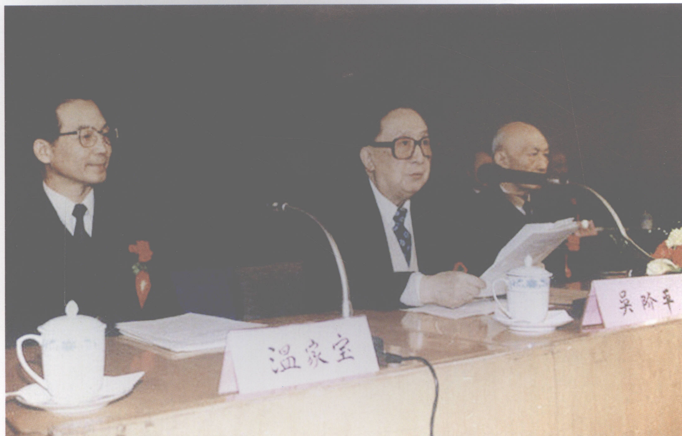
1994年3月，吴阶平和温家宝同志(左)在中华医学会第21届会员代表大会主席台上。