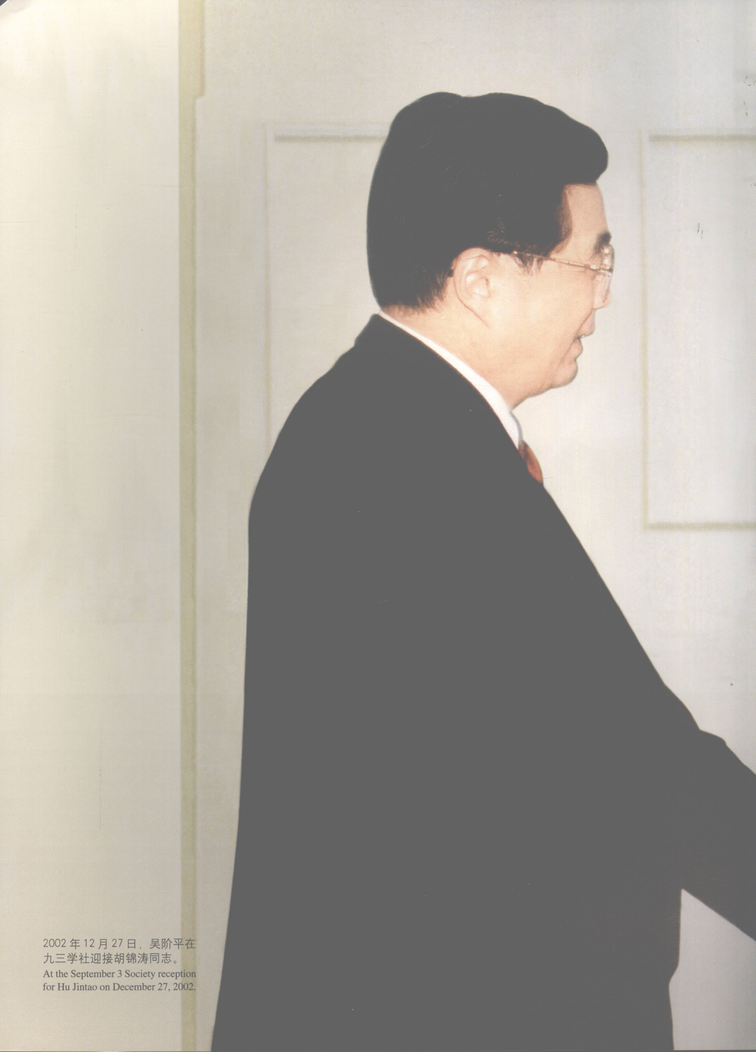
2002年12月27日，吴阶平在 九三学社迎接胡锦涛同志。 At the September 3 Society reception for Hu Jintao on December 27, 2002.