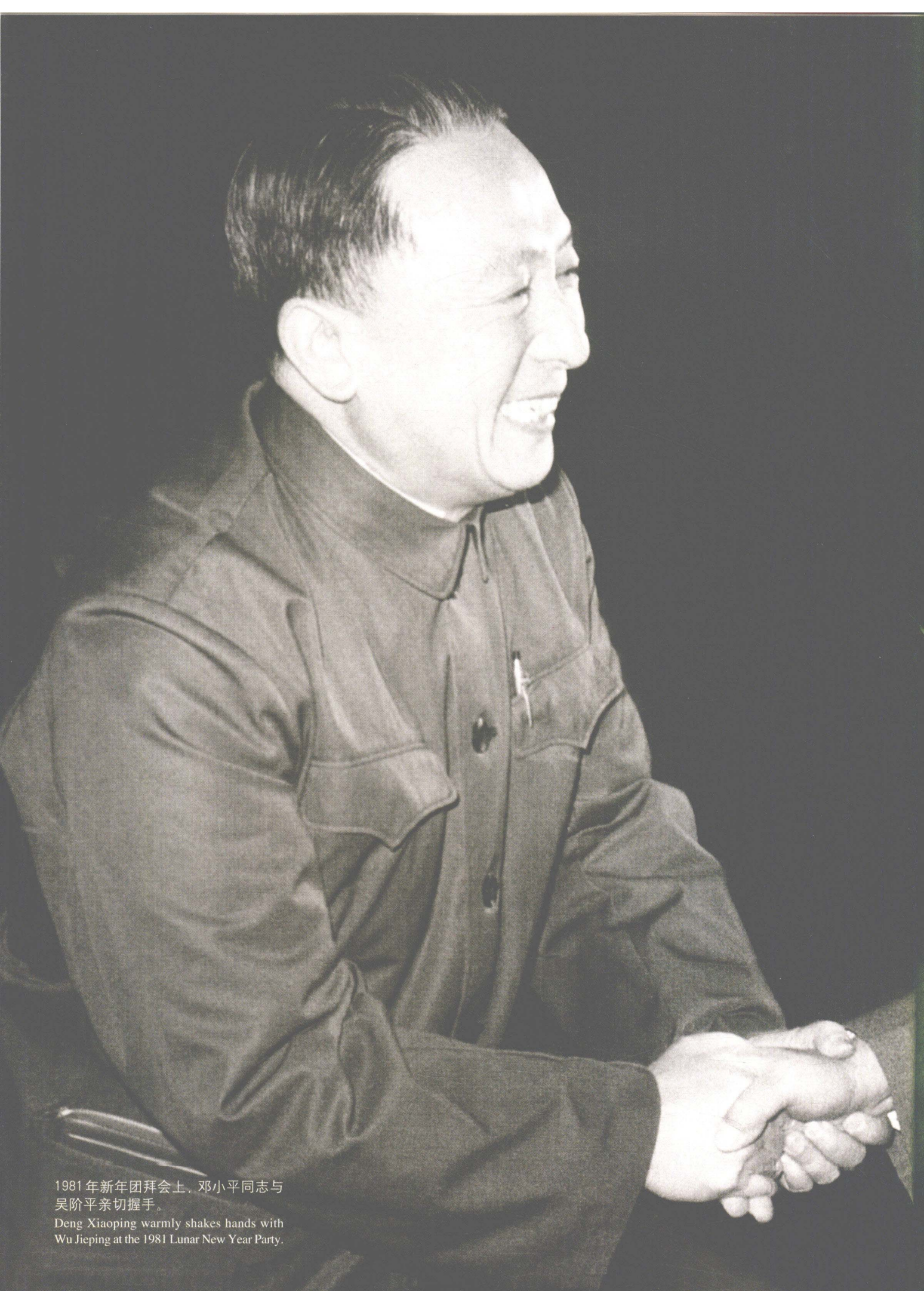
1981年新年团拜会上，邓小平同志与吴阶平亲切握手。