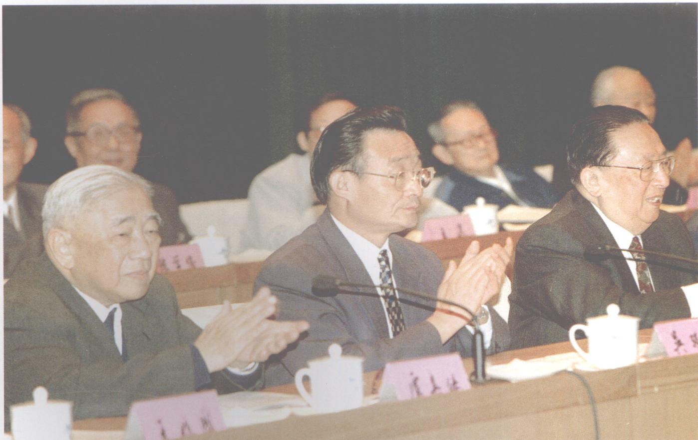
1997年11月8日，吴邦国同志(中)、吴阶平(右)、卢嘉锡(左)在九三学社第七次全国代表大会主席台上。