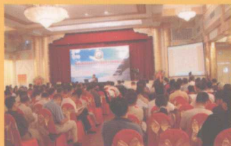
2004年9月9日巨天中在人民大会堂 讲授国学吉祥文化