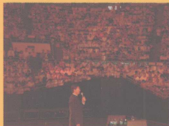
2005年7月16日巨天中在北京工人体育馆 万人大会上讲授国学姓名文化