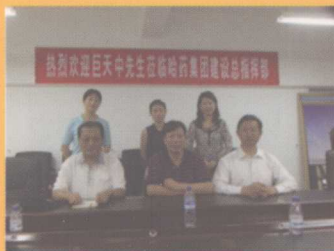
2005年7月12日巨天中在哈药集团