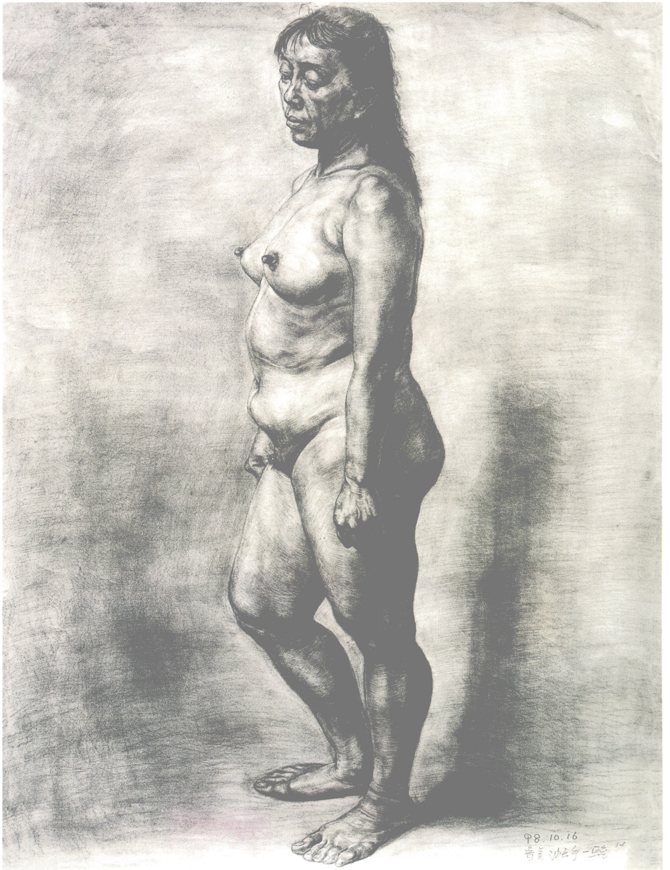
站立女人体●素描●第一工作室本科一年级●何杰