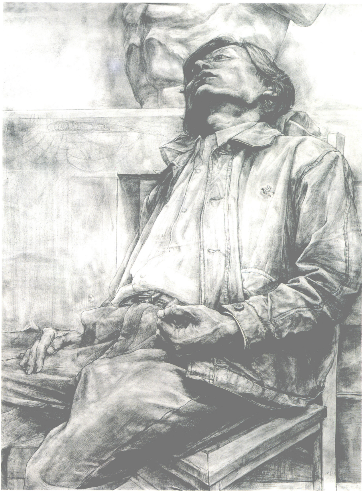
仰坐男人●素描●第一工作室本科一年级●全国吉