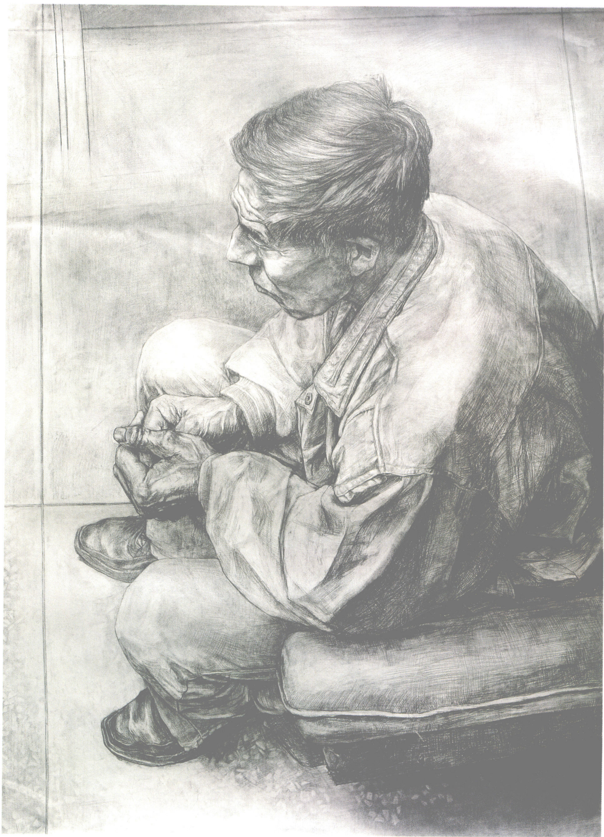
●坐沙发的男人●素描●第一工作室本科一年级●全国吉