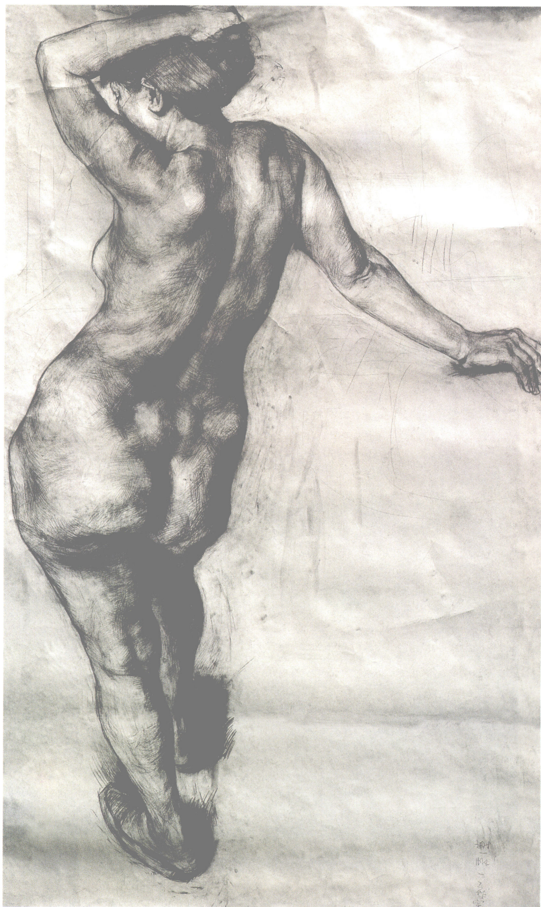
背面女人体●素描 ●第一工作室本科三年级 ●谢一帆