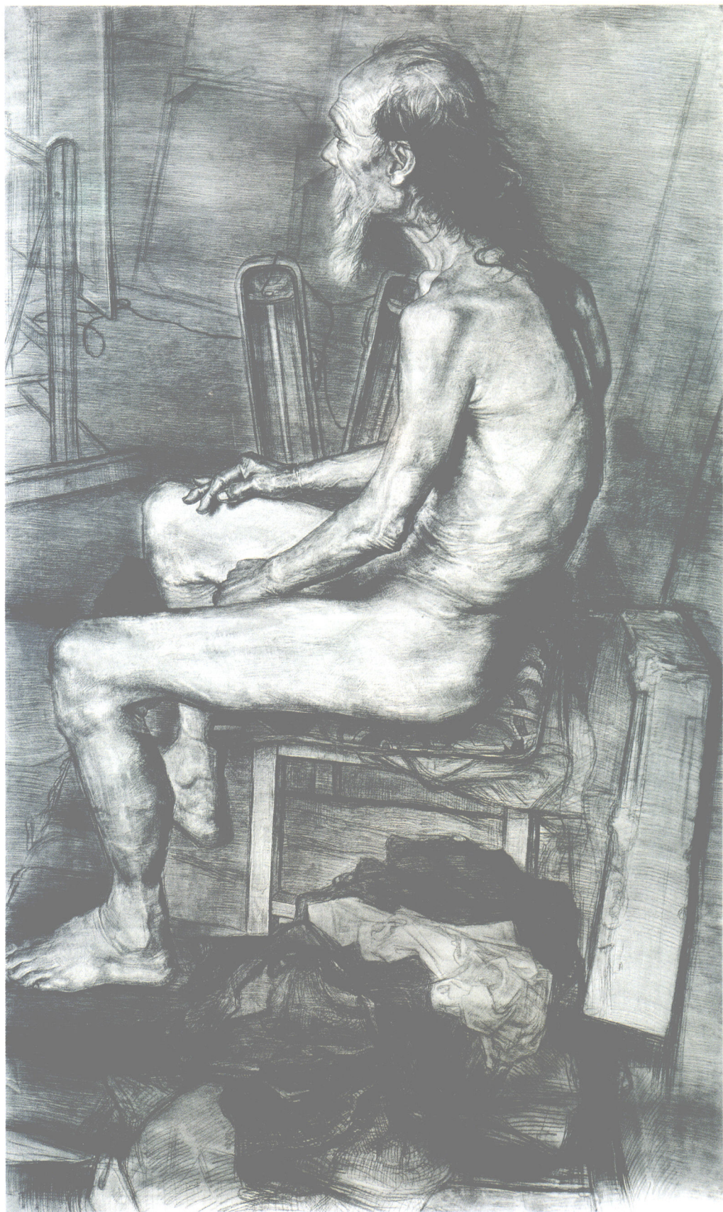
坐着的老人●素描 ●第一工作室本科二年级 ●董冰峰