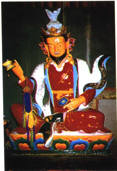
莲花王上师 ལུ་ཅན་ལྷ་མོ་ལྷོ་