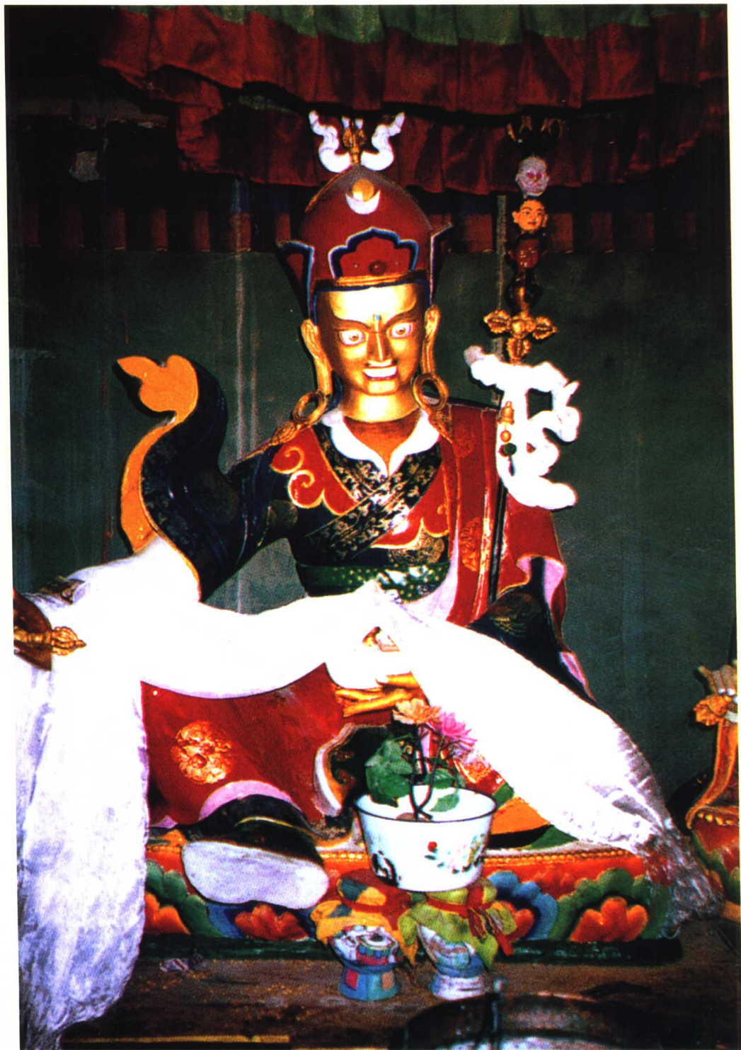
莲花生大师 ལུ་སྲ་བཟླ་འཕྱུང་གནས།