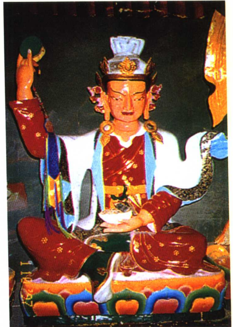
爱慧上师 ལུ་ཅན་ལྷ་མོ་ལྷོ་