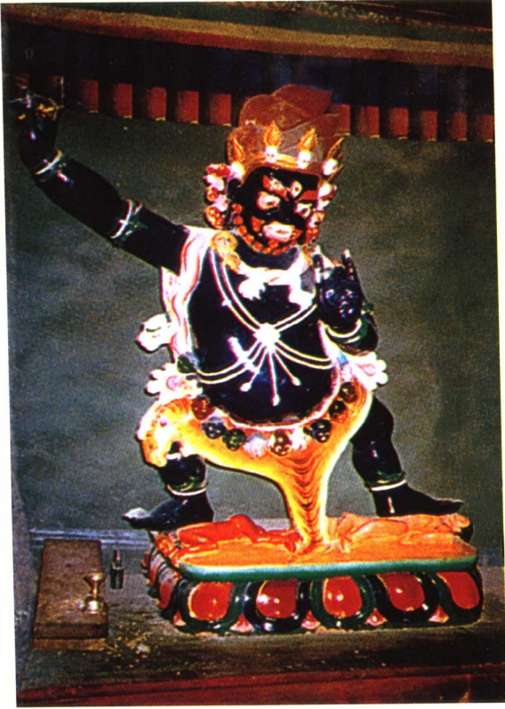
狮子吼上师 ལུ་ཅེ་ལྷོ་ལྷོ་ལྷོ་།