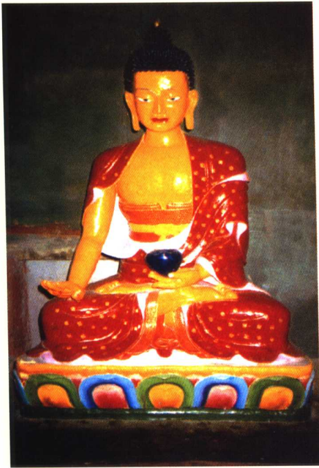
释迦狮子上师 ལུ་ཅན་ལྷ་མོ་ལྷོ་