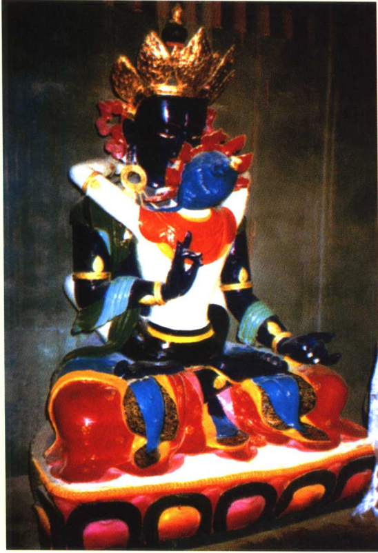
持金刚上师 ལུ་སྲོལ་རྒྱན་རྗེ་འཇམ་ལ།