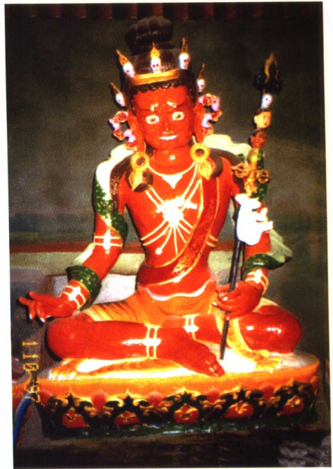
日光上师 ལུ་ཅན་མ་ཡོད་ཟེང་།