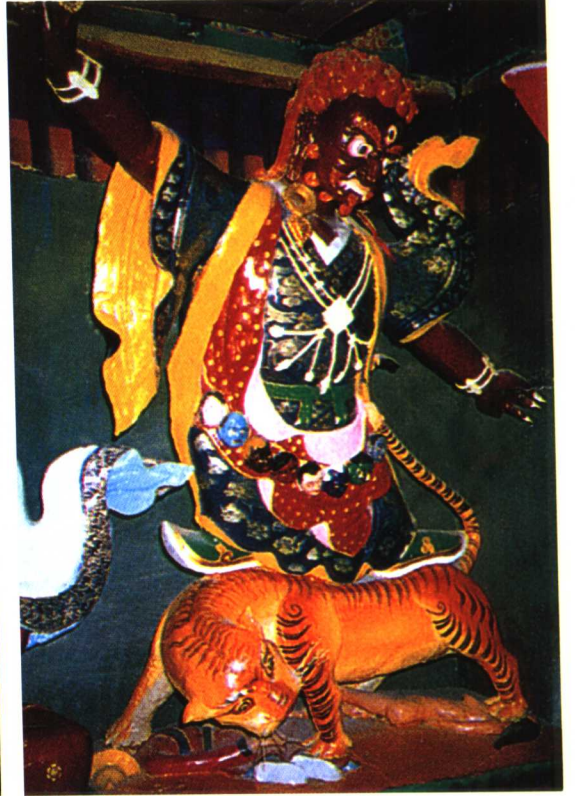
忿怒金刚上师 ལུ་ཅེ་རྗེ་ལྷོ་ལྷོ་།