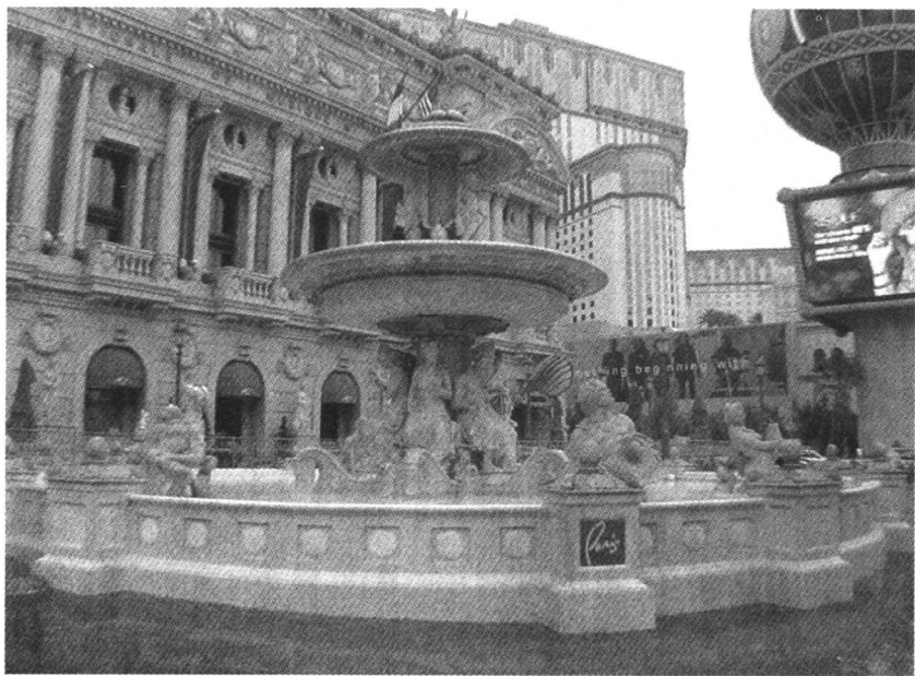
拉斯维加斯街景：拉斯维加斯街头很多雕像，这座泉中浮雕和它身后的欧式建筑，很有巴黎风情。

开车驶入拉斯维加斯最繁华的主街道，我们立即被一片灯海包围，几十米高的巨大的霓虹灯绵延数里，魔术师、性感女郎的大型广告灯一路朝你诱惑地诡笑，巨大无比的各种酒店招牌数里外即可见，一片灯红酒绿地让人应接不暇。全世界最富想象力的建筑师的智慧在这里争奇斗艳，一路上穿梭经过巴黎、威尼斯、纽约、古罗马建筑，刚经过音乐喷泉，还沉浸在视觉和听觉的双重洗礼中，前方又见到巨型火山突然喷