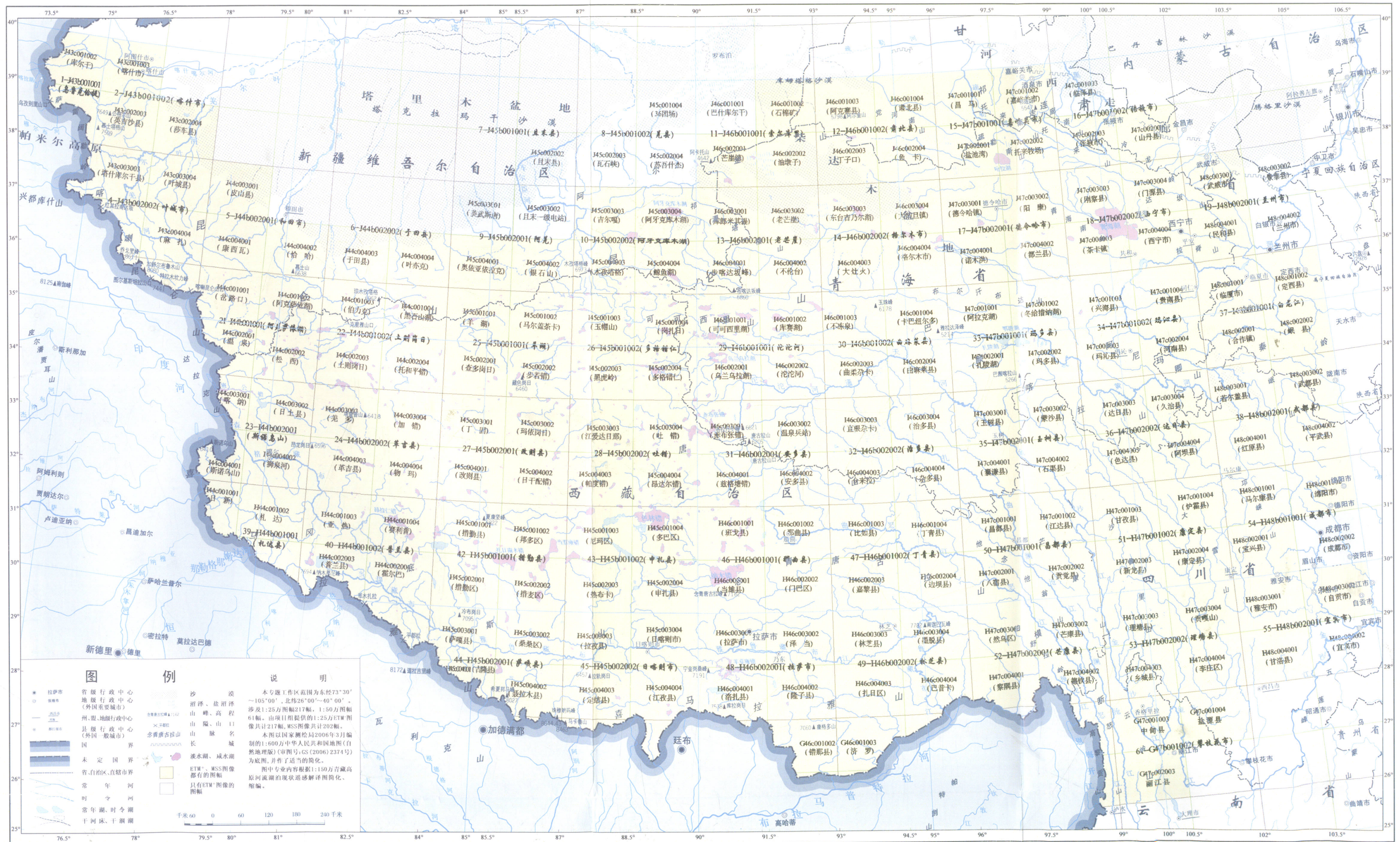
附图1 青藏高原1:2500000ETM+、MSS影像图接图表