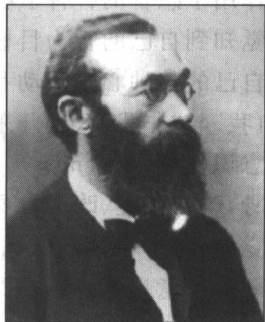
图 1-1 冯特

科学心理学的诞生，一般公认始自 1879 年冯特(Wilhelm Wundt, 1832—1920)在德国莱比锡大学建