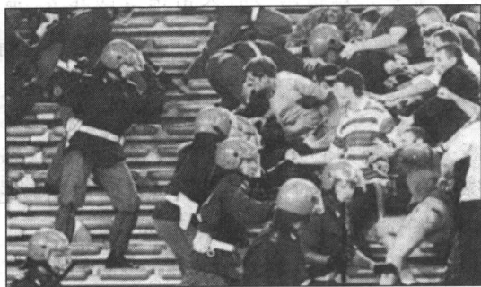
图 1-2 足球流氓暴乱

恶魔一般。这就是社会助长作用(social facilitation),即仅仅他人在场而没有提供直接的帮助,也有可能提高个体的工作效率。但是,另外一些情况下,他人在场可能反而会降低个体的工作效率。总之,心理学不仅研究个体心理,也研究群体心理以及个体心理与群体心理相互影响问题。