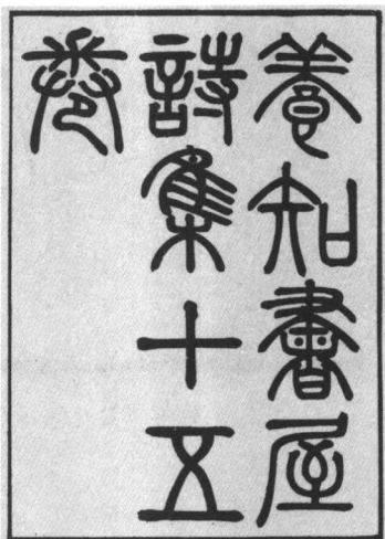
郭嵩焘《养知书屋文集》与《养知书屋诗集》扉页