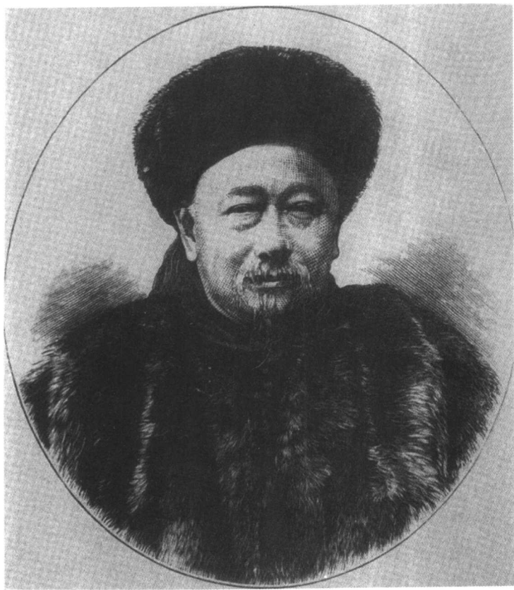
出使英国时之郭嵩焘