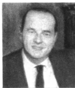
法国总统希拉克的亲笔致函：