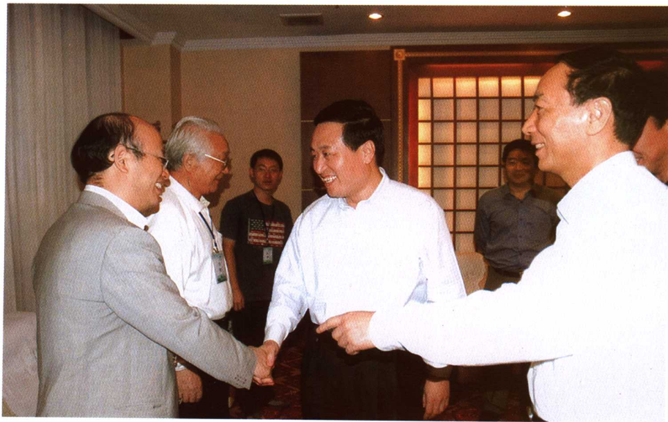
济宁市市委书记孙守刚看望与会专家