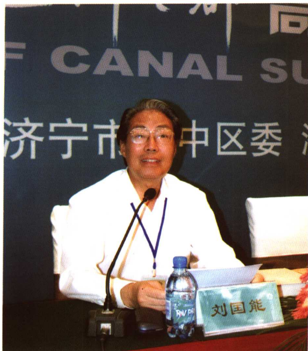
国家档案局副局长、中央档案馆原副馆长刘国能作论坛宣言