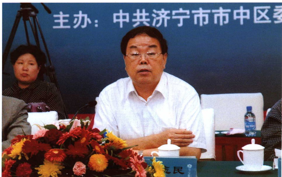
山东省政协副主席王志民主持研讨会