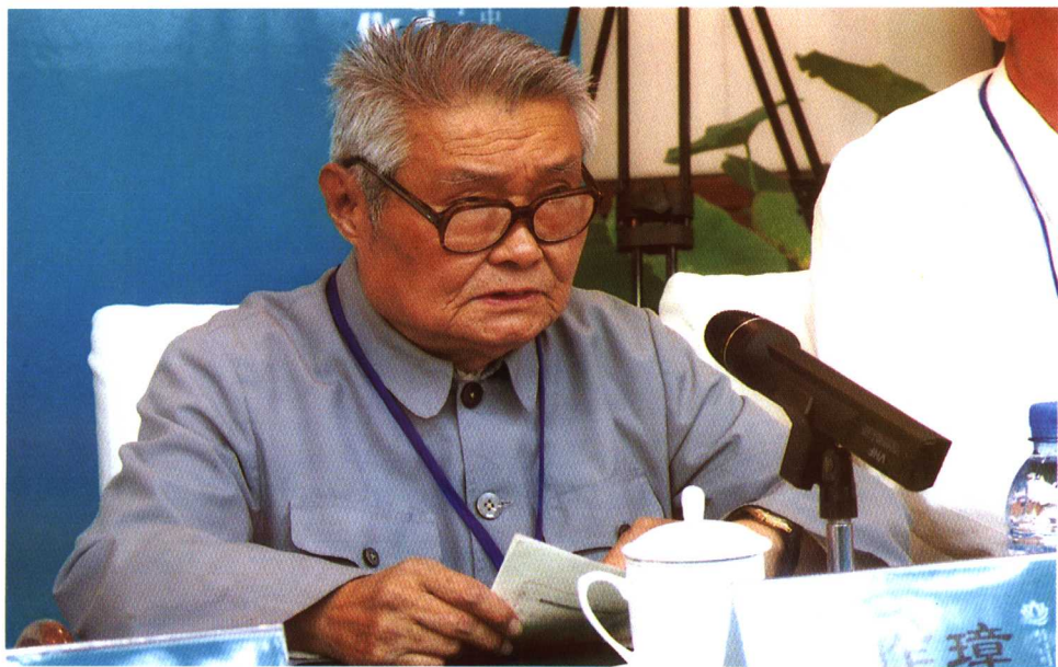
著名运河文化研究专家安作璋研讨发言