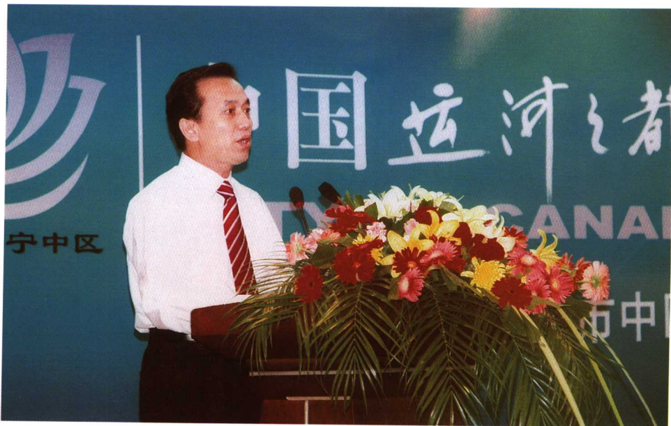
济宁市副市长陈民致辞