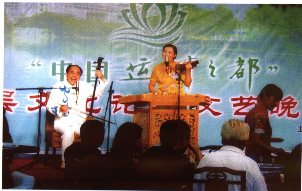
中国运河之都高层文化论坛文艺演出