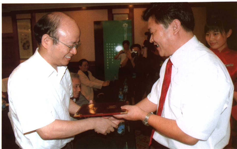
济宁市市中区委副书记、区长秦传滨颁发聘书