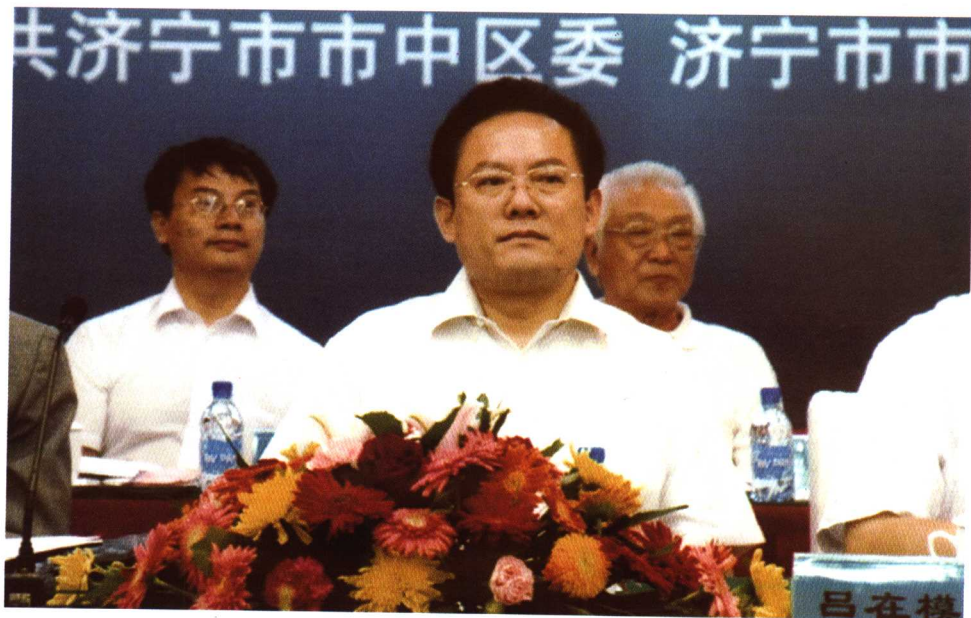
济宁市市长吕在模在开幕式上