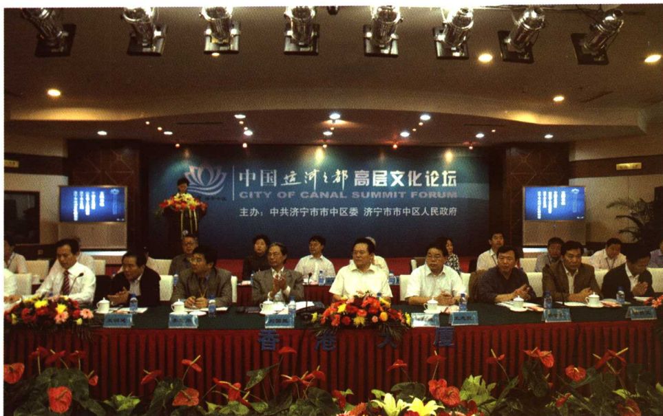
中国运河之都高层文化论坛研讨会现场