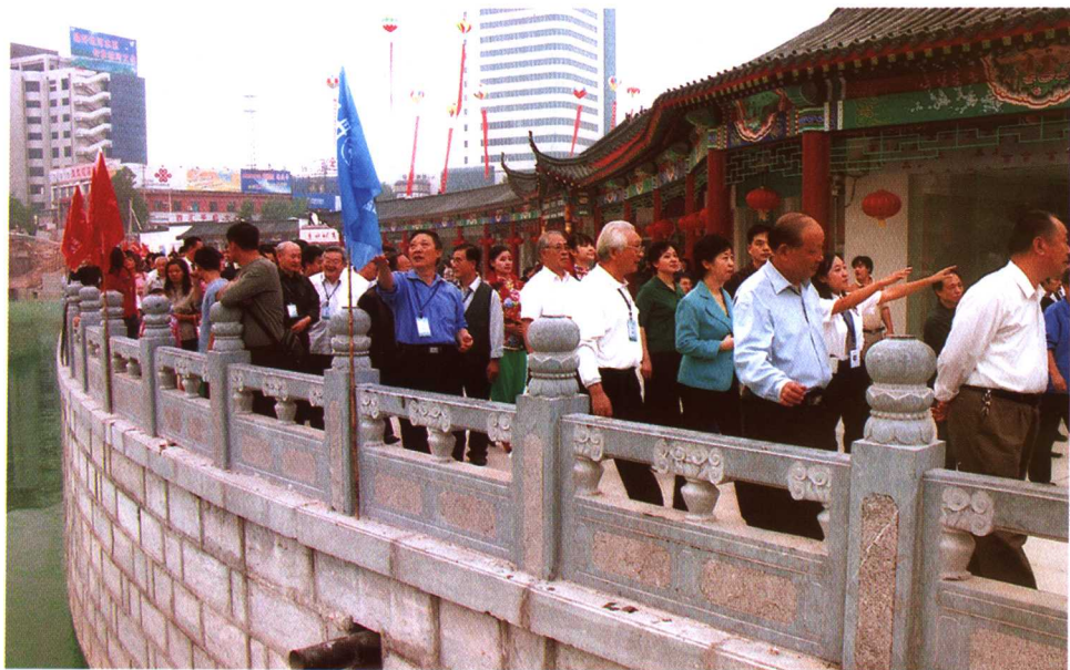
与会人员参观城区古运河