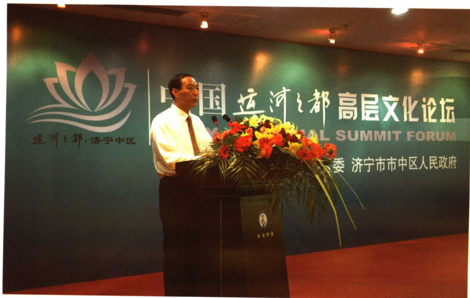
济宁市市中区委书记刘明远主持开幕式